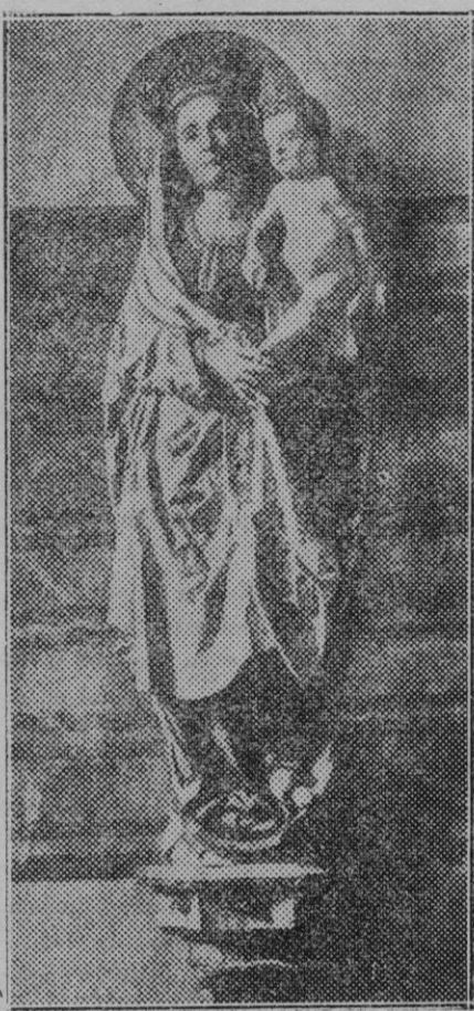
Imagen de la Virgen, obra del famoso ingeniero germánico Tilman Riemenschneider, que murió en 1531.

Apenado nuestro ánimo de católicas fervorosas ante los sucesos desarrollados en el mes pasado y ante los tristes pronósticos de la prensa, acudimos a V. E. cuyos cristianos sentimientos nos son conocidos, para rogarle que ni por ley ni por decreto sancione nada que sea en contra de la Religión Católica y de la existencia legal en España de las Ordenes Religiosas y que por ninguna razón tolere que se trate de la expulsión de la Compañía de Jesús ni de ninguna otra. Hablamos en nombre y por comisión de millares de mujeres católicas de Mallorca pidiéndole esa gracia que no dudamos