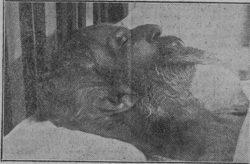
Aranjuez. — Santiago Russiñol en su lecho de muerte.