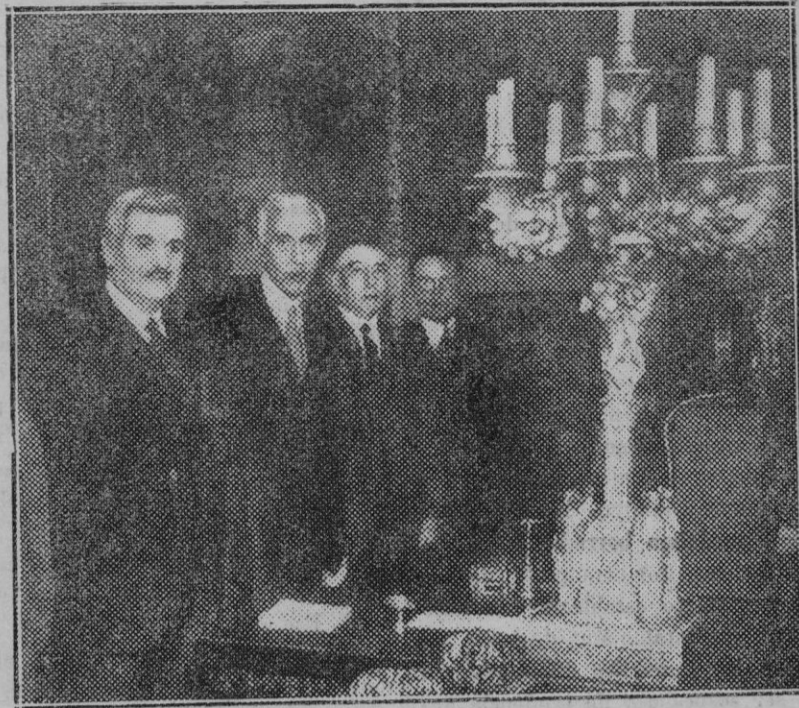
La Presidencia de la Asamblea de la Diputación provisional de la Generalidad de Cataluña, en el acto en que el Presidente don Francisco Maciá dió lectura a un discurso dirigido a los diputados.

les el señor Maciá cayó sobre él una lluvia de hojas de retama y de rosas, ovacionándole el público.