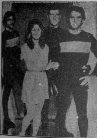
Randy Powell, Heather Menzies, Donald Moffat y Gregory Harrison.

Unos jinetes del desierto, comunican a Jessica, to, conminan a Jessica, Rem y Logan a que les acompañen a la Colonia,