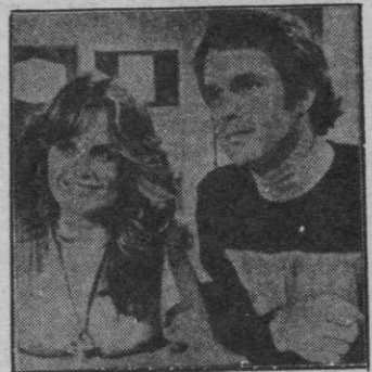
El Consejo de la ciudad de Las Cúpulas trata de que Jessica y Logan regresen para ser nuevamente programados.

En la ciudad de las Cúpulas, un fugitivo es muerto por el vigilante Hal 14, el Consejo, orde-