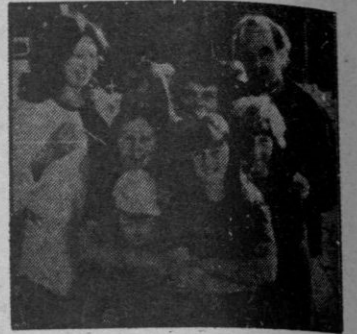
El matrimonio Ortega, con los chicos de Valle Secreto.

Los chicos de Valle Secreto se quedan atónitos cuando Araña aparenta haber cambiado totalmente y, diciendo que no volverá a ser malo, pide unirse a Valle Secreto. Los chicos le dicen que no. Pero verlo es creerlo y Araña está empeñado en demostrarles que ha cambiado. Es amable y amistoso con todos. Su pandilla se burla de él en público y