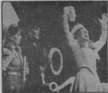
Las Hermanas Hurtado. "Cicutas" del programa.