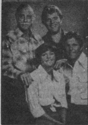
La protagonista de esta serie filmada en el archipiélago de Hawai.

Durante unos días de mucho trabajo, unos antiguos amigos se presentan a ver a Mitch. Van hacia Australia y pretenden que él les acompañe. Los problemas se amontonan: una cerca rota, troncos que hay que sacar, la nueva ca-