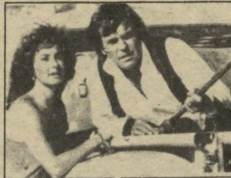
Stefanie Powers y Robert Wagner, como el matrimonio Hart.

Jonathan y Jennifer Hart reciben un telegrama donde se les invita a la boda de una antigua no-