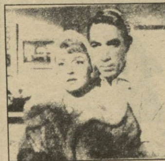
Lana Turner y Anthony Quinn, como la señora Cabot y el atormentado doctor Rivera.

Cabot Line es una empresa naviera con sede en San Francisco reputada como una de las más importantes del Pacífico. Su propietario, el señor Cabot, lleva años inmo-