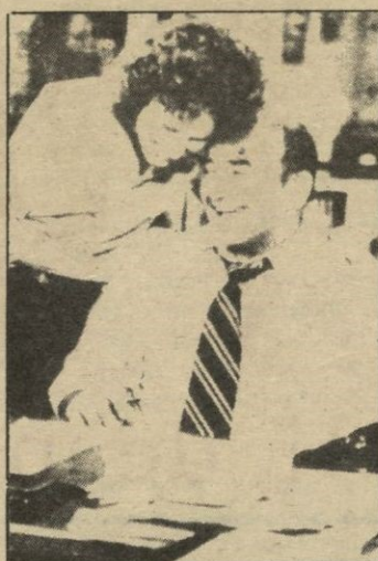
Edward Asner y Linda Kelsey.

A causa de una explosión se declara un incen-