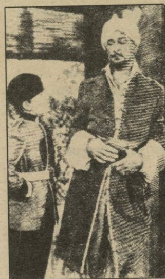
Dean Stockwell, como el pequeño Kim, junto a Errol Flynn, que interpreta a su protector, Mahbu Ali.

pal actividad es el vagabundeo, y su única fuente de ingresos, los pequeños robos que puede cometer aquí y allá. Un buen día, Kim traba amistad con un oficial de caballería miembro del Servicio Secreto Británico, y esta relación con el militar va a transformar por completo la existencia del muchacho.