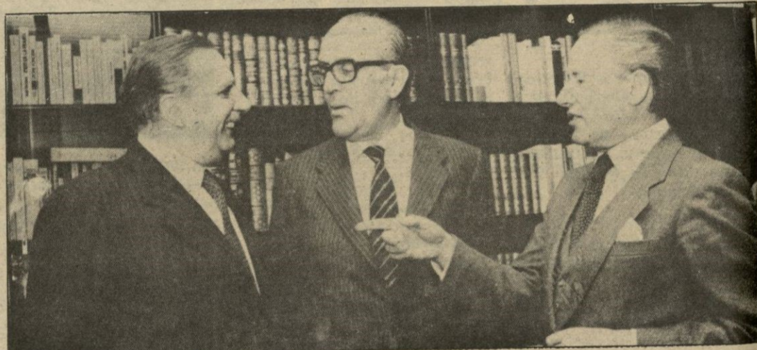
El pasado 22 de marzo se recogieron los primeros y verdaderos frutos en la negociación CEE-España. Semanas antes, Leopoldo Calvo-Sotelo había limado asperezas con Gaston Thorn, presidente de la Comisión, y con Lorenzo Natali.

30 de mayo: Después de múltiples negociaciones, el Rei-