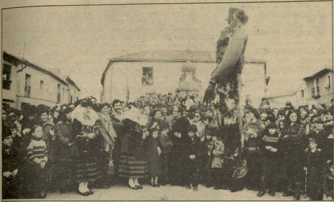
(Viene de la pág. 2)