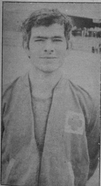
Borreguero: Trofeo a la regularidad

Una nueva firma comercial que acaba de ubicarse en Segovia, pero que tiene sedes en diferentes provincias españolas, va a prestar su apoyo al deporte segoviano, en este caso concreto el fútbol, estimulando el esfuerzo de los futbolistas. En este caso concreto de los de la G. Segoviana. Proincosa «Nuestra Sierra», que es la firma patrocinadora, ofrece cada semana un trofeo al mejor jugador azulgrana, haciendo entrega del mismo, que tendrá lugar en el pub «La Escuela», un jugador de fútbol de conocida trayectoria a nivel nacional. Esta tar-