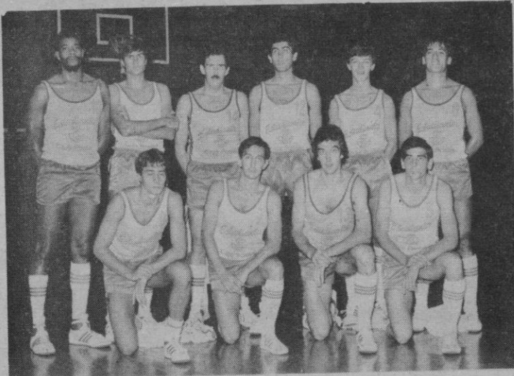
C. Estudiantes-Caja Postal

El club nace al amparo de un instituto de enseñanza: el «Ramiro de Maeztu», pasando por él grandes jugadores y siendo un espléndido vivero para otros clubs. El ambiente que rodea a todos los en-