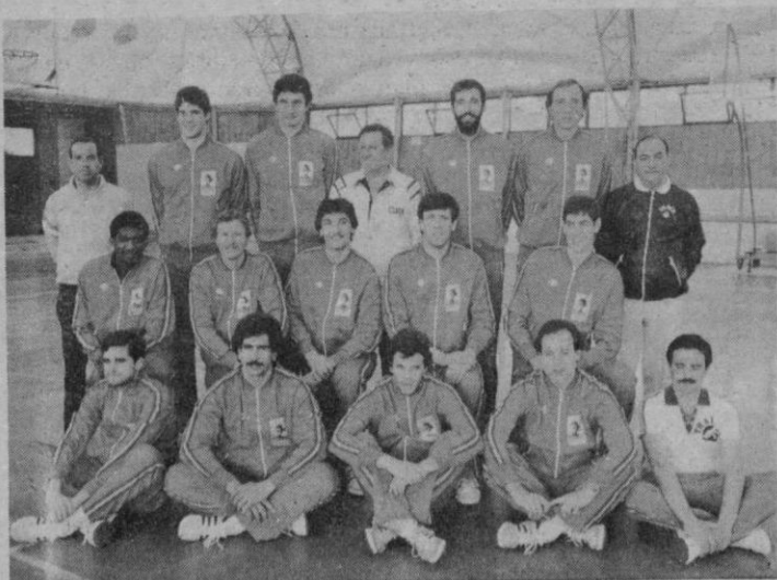
Selección Nacional por la que pasaron muchos de los jugadores que vendrán a Segovia