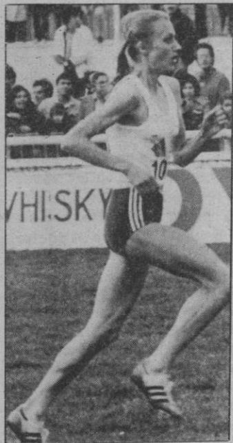
Espléndida figura de atleta y fenomenal instantánea de Aurelio. La noruega Grøte Waitz demostró ser la mejor atleta femenina del cross mundial. Corriendo con una facilidad de asombro, dejó «plantadas» a la norteamericana Jan Merrill y a la soviética Elena Sipatova, que entraron con el mismo tiempo.

que trabajo de firme por intentar llegar —y llegó—, donde su máquina podía detectar mejores imágenes, recogió una serie de ellas, muchas más de las que aquí hoy se publican, que merecía la pena fueran conocidas por aquellos que no tuvieron ocasión de acudir al Hipódromo de la Zarzuela. Y aquí están.