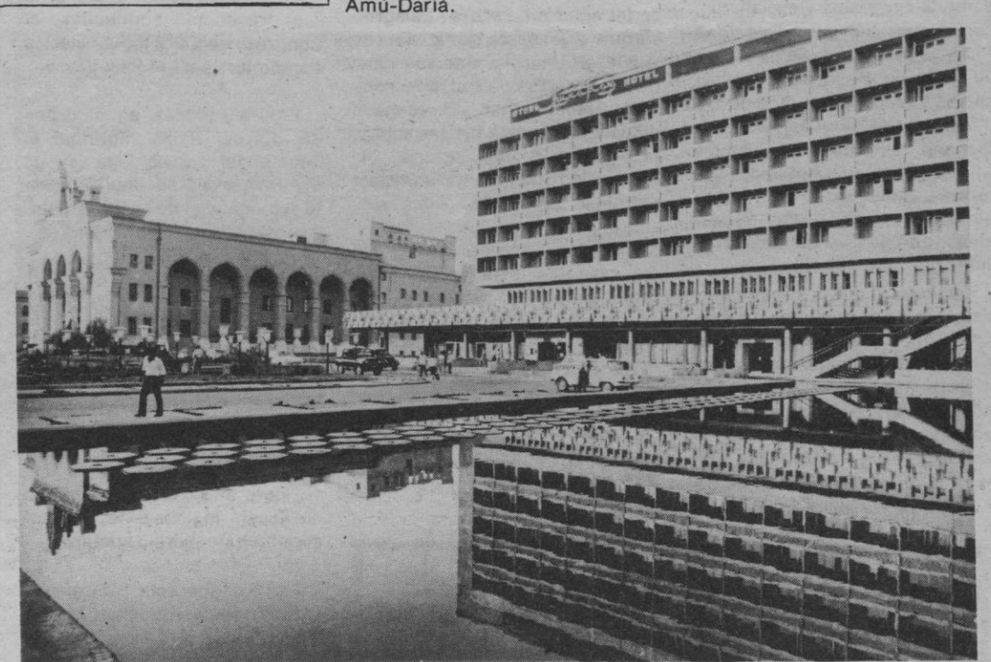
Arriba, el hotel «Ashjabad» en la ciudad del mismo nombre, y el teatro Turkmeno.

Gracias a la ayuda fraternal de todos los pueblos de la URSS, Ashjabad ocupa ahora tres veces más territorio que antes, y la cantidad de viviendas en la ciudad aumentó en seis veces, convirtiéndose ésta en una de las más urbanizadas y con mayor área verde del país. A ello contribuyó también la construcción de un canal de 1.000 kilómetros de longitud, por el que a la ciudad llega el agua del río Amú-Dariá.