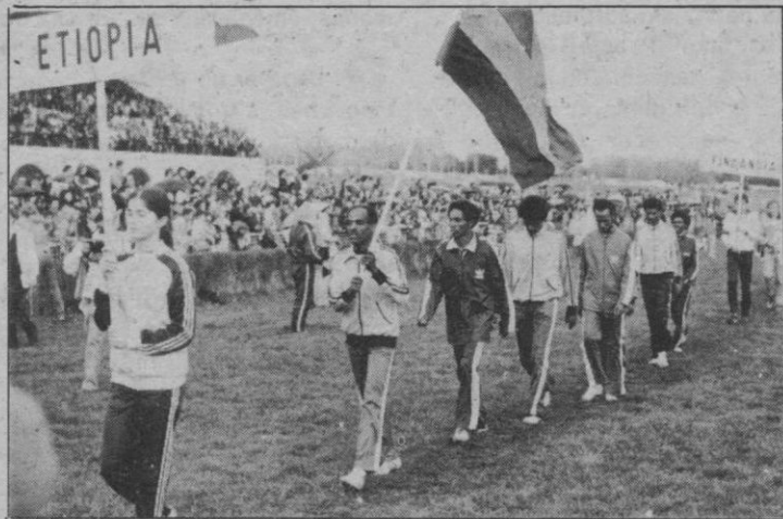
Son los animadores de la carrera. Los que por un fallo de última hora perdieron todo lo que con su maravillosa forma de correr habían ganado a lo largo de 9,500 metros. El segundo es Miruts Yifter, que luego defraudaría. El último Mohamed Kedir, que lucharía por el primer puesto trenté a Virgin.