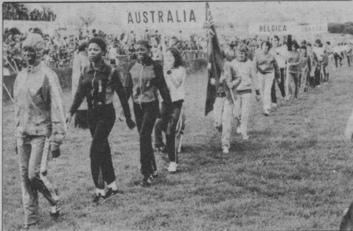
Parte de las atletas angoleñas que vinieron a participar. Pero sólo a eso, puesto que tomaron la cosa con filosofía y corriendo «a su aire» entraron las últimas