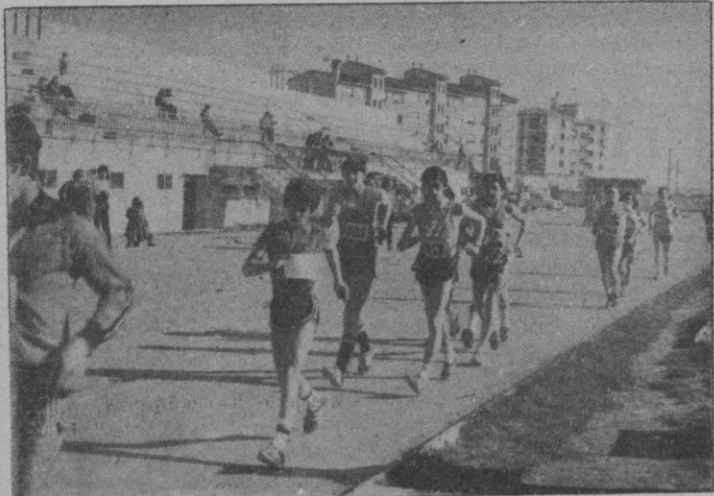
Momento de una competición en las pistas de atletismo