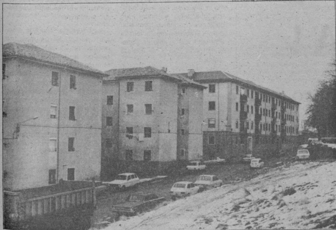
Una de las calles del barrio. Un barrio con bastantes problemas

cuenta— este barrio ha sido siempre «Larrucea» y vivir aquí era como pertenecer a otra clase. Esto lo digo sin rencor, pero es cierto y todavía ocurre algunas veces».