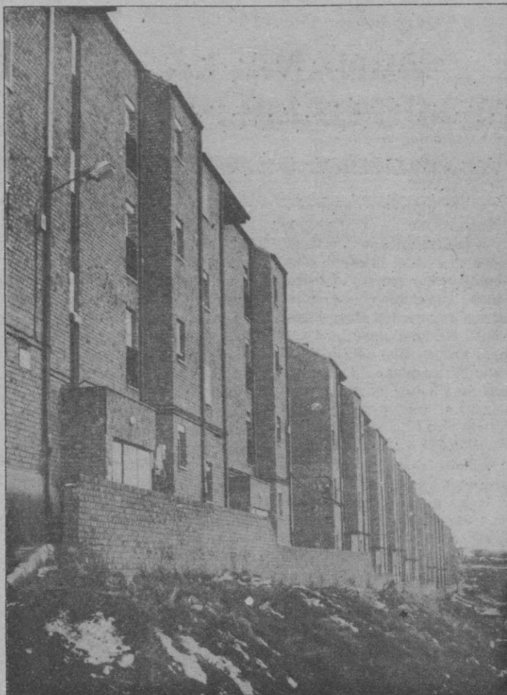
El Polígono «Mirasierra», forma parte del barrio