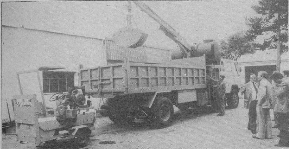
Uno de los nuevos equipos para bacheo

268 MILLONES DE PESETAS SE INVIERTEN ESTE AÑO EN LA SECCION DE VIAS Y OBRAS