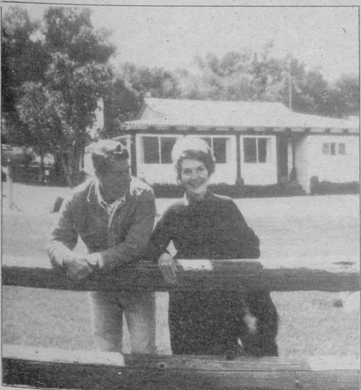
El matrimonio Reagan en la casa que poseen en el rancho de su propiedad en Santa Bárbara (California)

País Vasco CUATRO GUARDIAS CIVILES Y UN PAISANO, ASELINADOS EN ZARAUZ