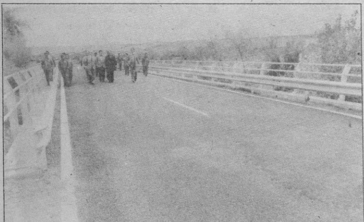
El puente de Allas sobre el río Moros

En un recorrido realizado ayer por diversas carreteras de la provincia, quedaron inaugurados los puentes de Coca y Allas, visitándose también los talleres de la Diputación donde se mostró uno de los equipos de bacheo adquiridos por ésta. Asimismo, dentro del recorrido, se pudo observar en su trabajo a un equipo de gran reparación en la carretera de Sta. María a Jemuño; el puente de Juarros, cuyas obras de nueva realización se iniciarán en breve y el tramo de carretera de Sangarcía al Puente Uñéz, donde se ha efectuado un riego de conservación.