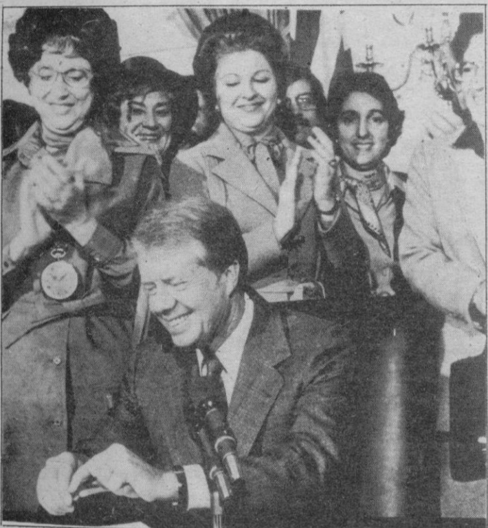
El Presidente Carter, rodeado de mujeres congresistas, funcionarias y partidarias de la Enmienda para la igualdad de Derechos