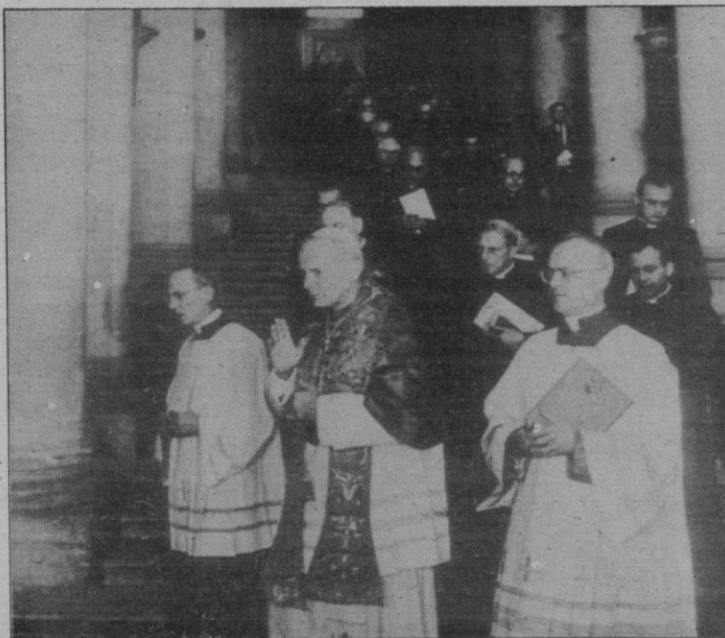
Ciudad del Vaticano.— El Papa Juan Pablo II precede a los obispos por la Scala Regia, en el Vaticano, tras la clausura del Sínodo.

Con la publicación de un mensaje a la familia cristiana en la Ciudad del Vaticano al V Sínodo de los Obispos. En su mensaje, los padres sinodales denuncian la violación de los derechos de la familia por algunos Gobiernos