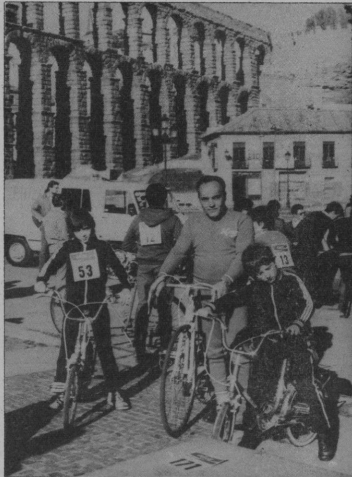
Mayores y pequeños unidos por una misma afición: la bicicleta.

Alrededor de unas doscientas cincuenta personas (niños, mujeres y hombres; familias completas, incluso) tomaron parte ayer por la mañana en la «Fiesta de la Bicicleta», que organizaron conjuntamente el C.P. OAR y la Sociedad Ciclista Segoviana, con el patrocinio del Consejo Superior de Deportes.