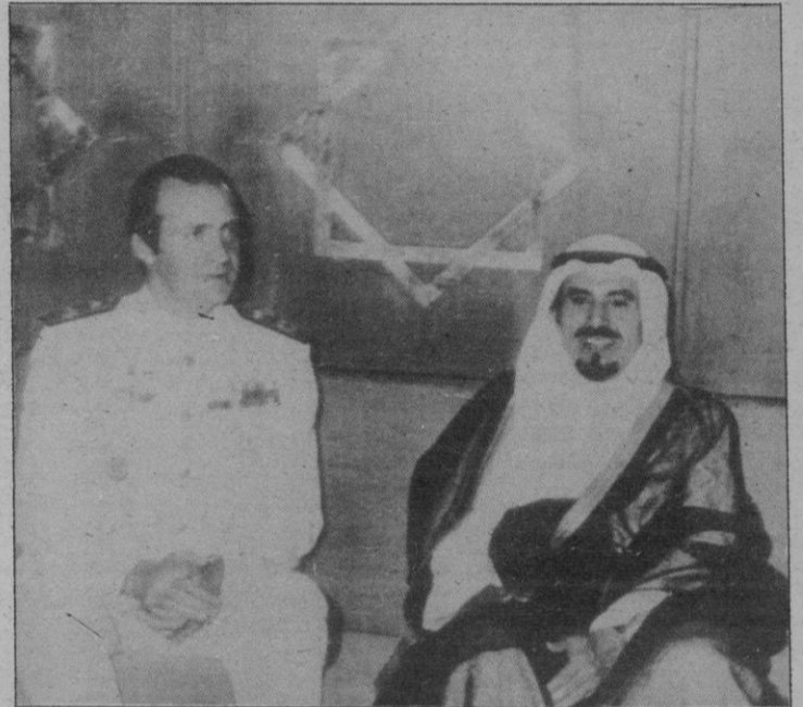
Kuwait.— Los Reyes de España, don Juan Carlos y doña Sofía, llegaron a primeras horas de la tarde del sábado a Kuwait, primera etapa de su viaje oficial que abarcará también a Japón e Indonesia. La visita a Kuwait, concluyó ayer por la tarde, tras una recepción en la colonia española, una entrevista con el Emir y un almuerzo privado. En la foto, el Rey don Juan Carlos junto al Jefe de Kuwait, Jaber Al-Ahmad Al Sabah, en la sala de autoridades del aeropuerto kuwaití tras la llegada de los monarcas españoles a aquel país.

El programa de hoy se limitará a la recepción oficial de Sus Majestades en el aeropuerto, a las cuatro de la tarde hora local (diez de la mañana, hora española), y a una cena en privado. Los actos continuarán mañana a primera hora con una visita al Palacio Imperial, donde serán recibidos por los emperadores de Japón, y proseguirán hasta la mañana del próximo viernes 31, fecha en que seguirán viaje a Yakarta.—Efe.