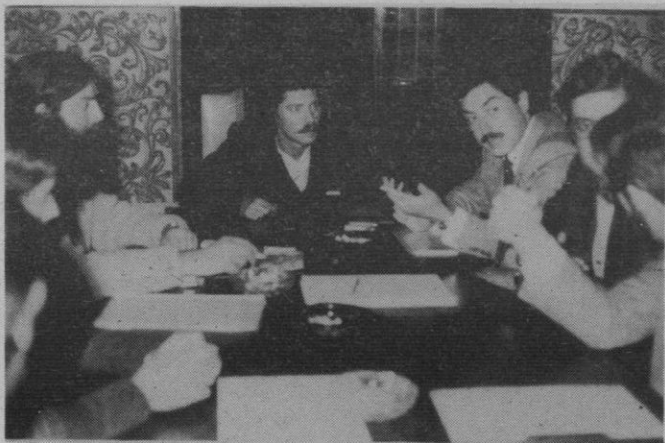
Un momento de la rueda de prensa.

Tendrá dos aspectos: El formativo y el recreativo