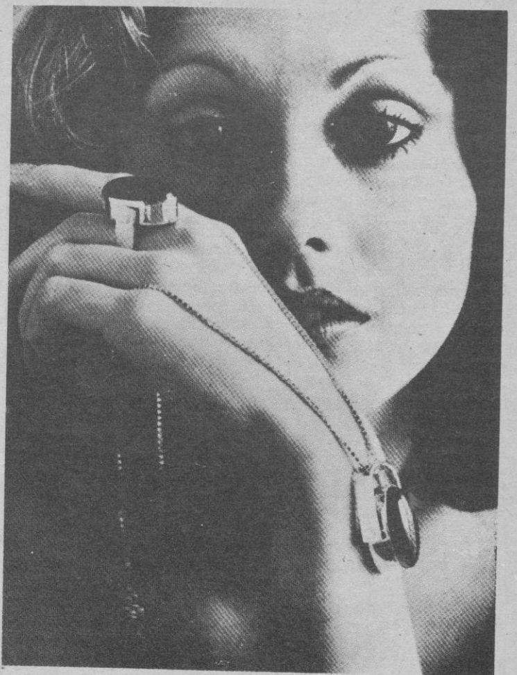
El nombre de Hans Hansen representa a una de las firmas plateras más antiguas de Dinamarca, fundada en 1906.

Hans Hansen manufactura cubiertos de mesa y artículos decorativos en plata fina. También hace piezas exclusivas en oro de 14 quilates. Su producción más reciente comprende esculturas de plata, hechas en un número limitado.