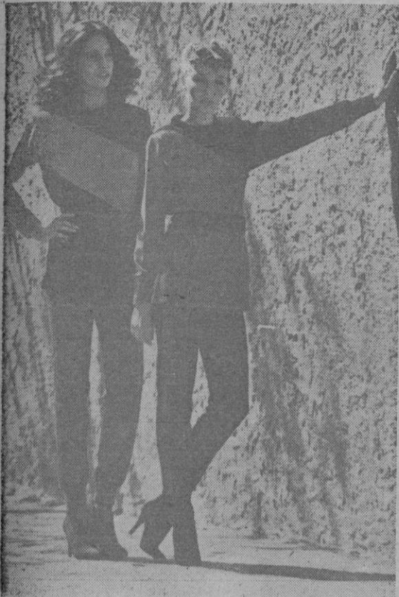
Modelos diseñados por Claude Montana para la firma española Ferrer y Sentís, realizados en lana merina extrafina

La variedad más selecta de todas. Con este nombre se conoce en todo el mundo a la lana cuyo grosor promedio es igual o menor a 19.5 micras. (Una micra es equivalente a una milésima de milímetro y la lana usualmente utilizada en España oscila entre las 21 y 25 micras).