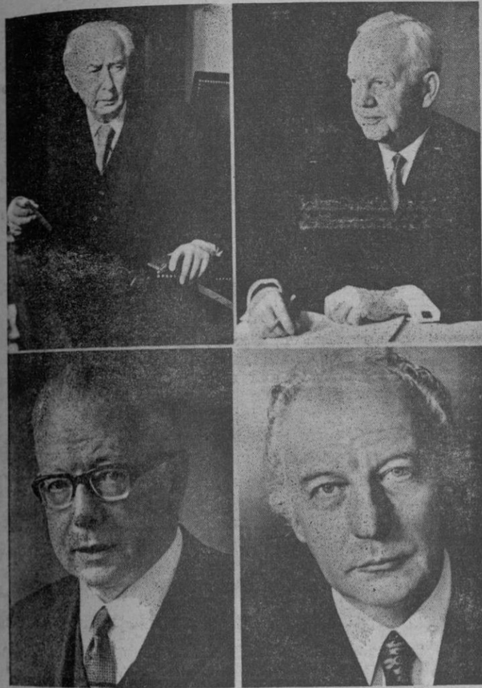
De izquierda a derecha: Arriba, Theodor Heuss y Heinrich Lübke; abajo, Gustav W. Heinemann y Walter Scheel

Mañana se elegirá el quinto Presidente de la República Federal de Alemania