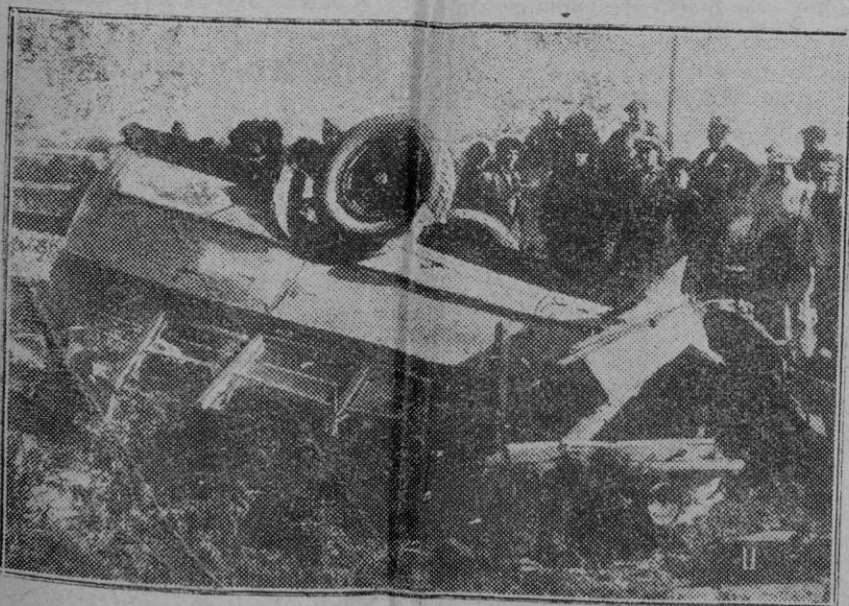
Valencia. — Autobús que fué arrollado por el tren, resultando de la catástrofe dos muertos y dos heridos.

Al lugar del suceso acudió el Juzgado de guardia y el médico forense ordenando la conducción del cadáver al cementerio.