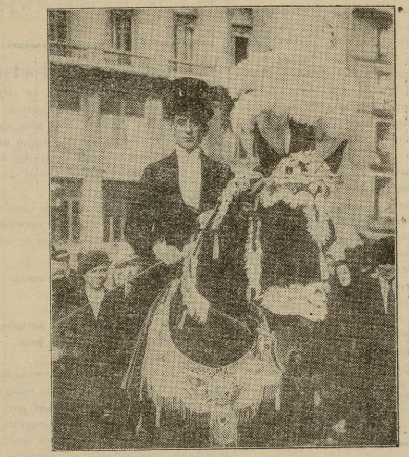
Barcelona. — Un típico comparsa de los "Tres toms", con motivo de la festividad de San Antonio Abad.

bre tot en les consciències individuals ja que després és molt més factible la coordinació de totes i formar-ne una colectiva ben amarrada de tan noble sentiment.