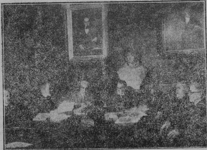
Barcelona. — En el Colegio de Abogados. Acto de la firma del Apéndice catalán al Código Civil que ha de cursarse a Madrid.