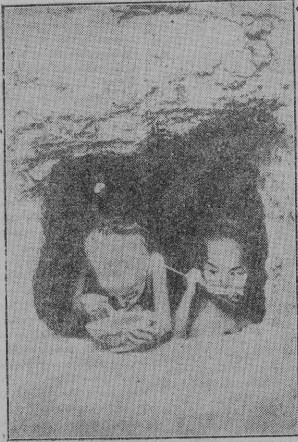
Pekín. — Niños hambrientos comiendo vorazmente el alimento que les ofrecen las misiones, a la puerta de las cuevas en que habitan.