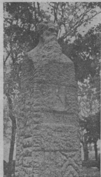
Busto de Daniel Zuloaga (Barral) en los jardines de la plaza de Colmenares.

tres virtudes teológicas directamente en piedra amarilla de Sepúlveda.