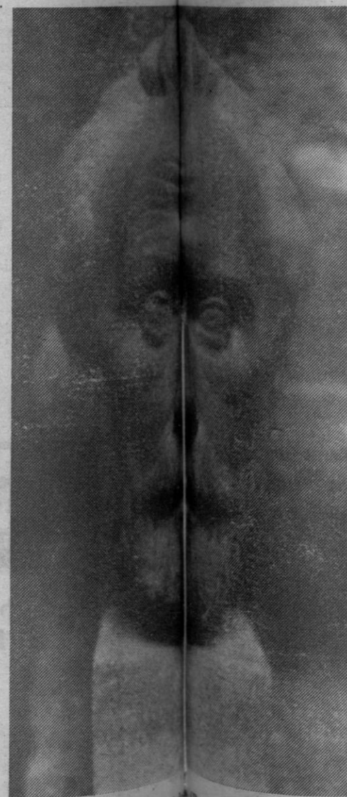
Cabeza de Pablo Iglesias (Barral) en el Museo Provincial de Segovia

A partir de este trabajo escultórico se hace cada vez más intensa son estas obras: Monumento a don Víctor Balaguer en Burgo de Osma, mausoleo a Pablo Iglesias en el cementerio civil de Madrid, monumento a don Arias de Aranda de Duero, así como los bustos de Gregorio Marañón, Nôvoa Santos y Bastos, los de Ro-