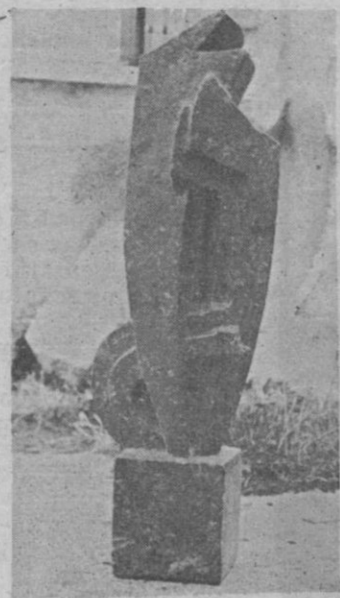
Una obra de Barral

Había nacido en Sepúlveda en 1896, hijo y nieto por ambas ramas de maestros canteros, a los ocho años comienza a modelar en arcilla. Su espíritu inquieto le lleva a viajar por Burgos, Valencia, Barcelona, Marsella y París. Ciudad ésta donde cumple los catorce años. Entre los diecisiete y los veinte años realiza en Sepúlveda una serie de obras funerarias. De ellas son notables tres ángeles y sobre todo un alto relieve con las