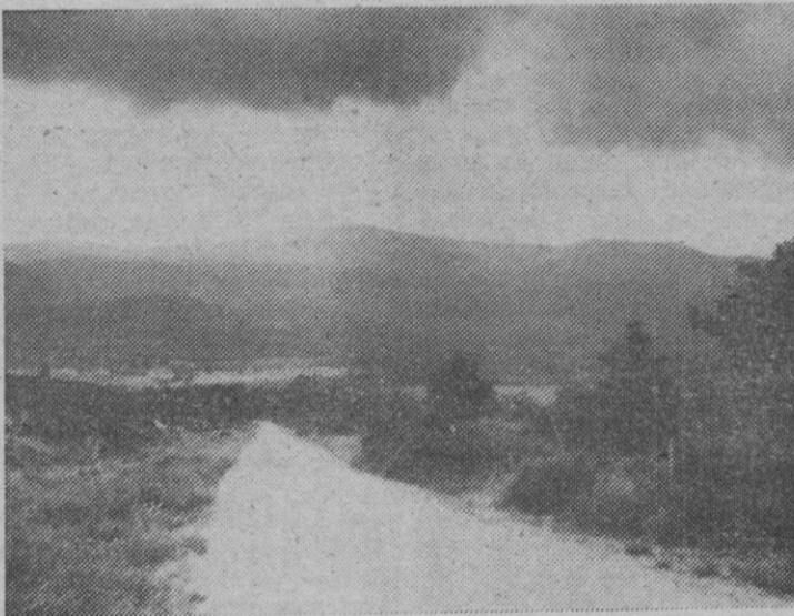
Carretera de acceso a Valsaín desde la Fuenfría; al fondo, la ladera esquiable de Peñalara

B—Area de Servicios, situada en la proximidad del núcleo urbano de La Granja, y donde se establecerían