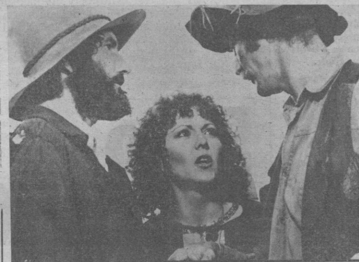
Esta escena corresponde a la nueva serie «Sara», cuyo comienzo de emisión está prevista para el día 26 próximo. El papel principal, el de «Sara Yarnell» está incorporado por la actriz Brenda Vaccaro. En el reparto figuran los actores Louise Latham, Bert Kramer y Albert Stratton.