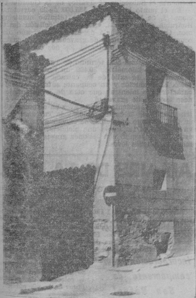
He aquí la señal que prohíbe el paso a los vehículos que suben por la calle de San Agustín, pero no a los que bajan.

Los desvíos provisionales por causa de obras deberían anunciarse previamente