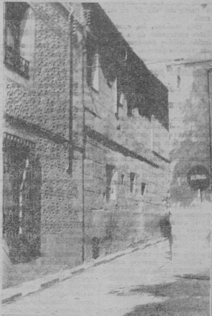
En esta calle tan «ancha» ¿es posible estacionarse? Pero, no obstante, los bordillos están pintados de rojo y blanco.

Y ya metidos en el tema, señalemos, una vez más —aunque con escasas esperanzas de ver algo positivo— la necesidad de habilitar aparcamientos, dado que el volumen de vehículos que circula diariamente por la ciudad es muy elevado, aumentando más cada día y ahora, además, con la circunstancia de producirse una llegada diaria de muchos coches procedentes de otras provincias. El hecho se ve palpablemente. En los lugares —placitas, calles, rincones— donde siempre ha habido todavía huecos para dejar un automóvil, hoy aparecen cubiertos a todas horas, por lo que muchas veces resulta prácticamente imposible aparcar en amplias zonas de la parte antigua de la capital.