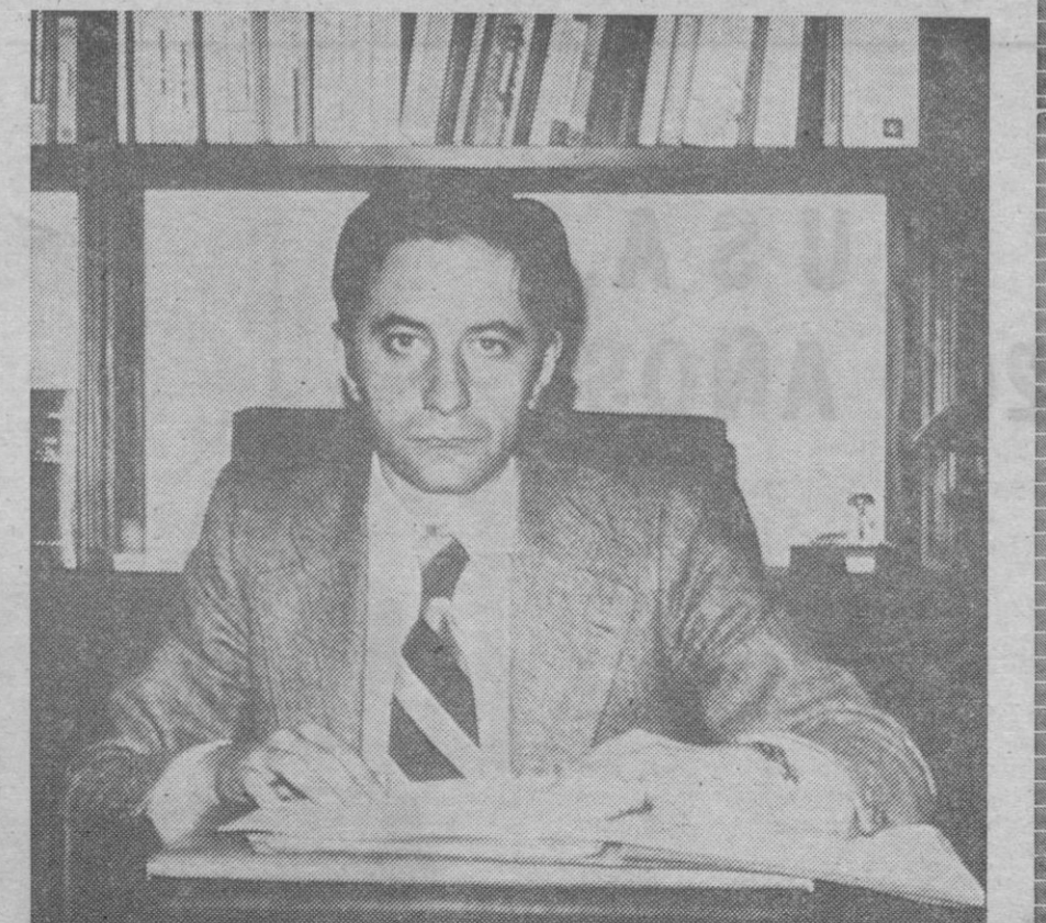
«Sería interesante desglosar física y acaso jurídicamente la Biblioteca Pública del Archivo Histórico, siendo este último el único servicio que debería estar ubicado en el edificio actual»