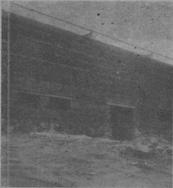
Ladrillo a ladrillo, los vestuarios van tomando forma

Pues señor; que ahora resulta—gracias sean dadas por bien del deporte—que en los campos de la provincia además de florecer el trigo o los garbanzos, junto a los que crece el pino, también se «siembran» estadios para la práctica del fútbol. Ahí lo estamos viendo en algunas localidades segovianas, a las que en un futuro no lejano se sumarán otras. Es alentador comprobar cómo el hormigón y el hierro van tomando forma y de aquí a no mucho tiempo la muchachada podrá correr tras el balón en busca del gol de la victoria—¿y quién sabe?—si también en pos del contrato para un club de campanillas.