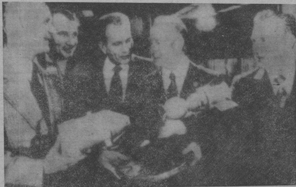
Cosmonautas de USA y de la URSS, reunidos en el centro espacial Johnson, en franca amistad, para comenzar los entrenamientos del programa espacial conjunto de ambas naciones, contemplan una maqueta de dos aeronaves ensambladas