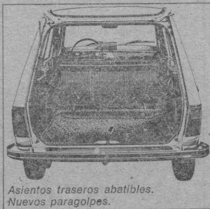
Asientos traseros abatibles. Nuevos paragolpes.

tajas —solidez mecánica, capacidad y buen rendimiento—, el Renault 6 de siempre aparece hoy más actual: Nueva calandra, faros rectangulares, nuevos paragolpes, con pilotos empotrados