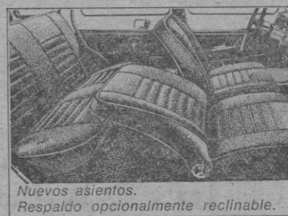
Nuevos asientos. Respaldo opcionalmente reclinable.

cambiables. Potencia DIN 44 CV a 5.900 r.p.m. Par máximo DIN 6,7 kg. m. a 3.500 r.p.m. Batería 12 V. 4 velocidades sincronizadas. Velocidad 130 km/h. Consumo 6,5 l. cada 100 km. a una velocidad de 80 km. de media, en terreno me-