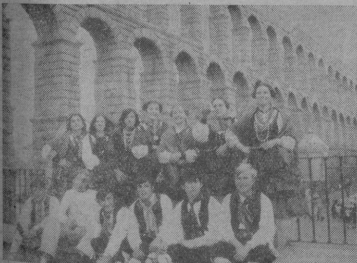
Grupo de danzas de Cabezuela

rior que permita llegar a unas instalaciones ganaderas de un tamaño tal que aumentando la productividad de las personas dedicadas a este cometido, aumente la rentabilidad de esta actividad.