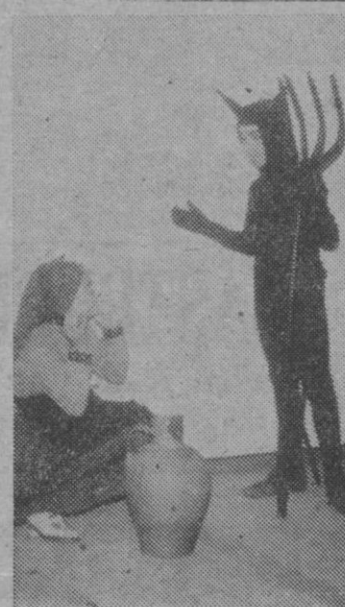
Una escena de la «Leyenda del acueducto» interpretada en el Teleclub de Cabezuela.

Ya sólo nos queda hablar un poco del futuro, en donde, junto a su anónima y rutinaria agricultura cerealista de secano, se alza el reto que la producción de madera lanzará a las gentes de este lugar en