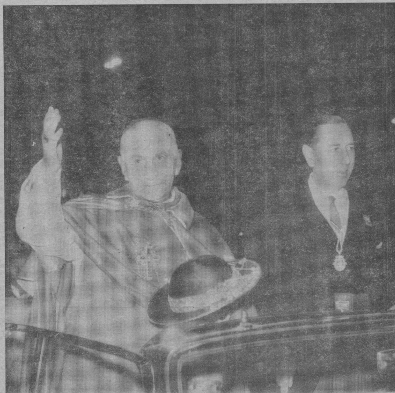
El cardenal don Angel Herrera, acompañado del alcalde de Málaga, a su entrada en aquella ciudad, después de recibir la birreta cardenalicia