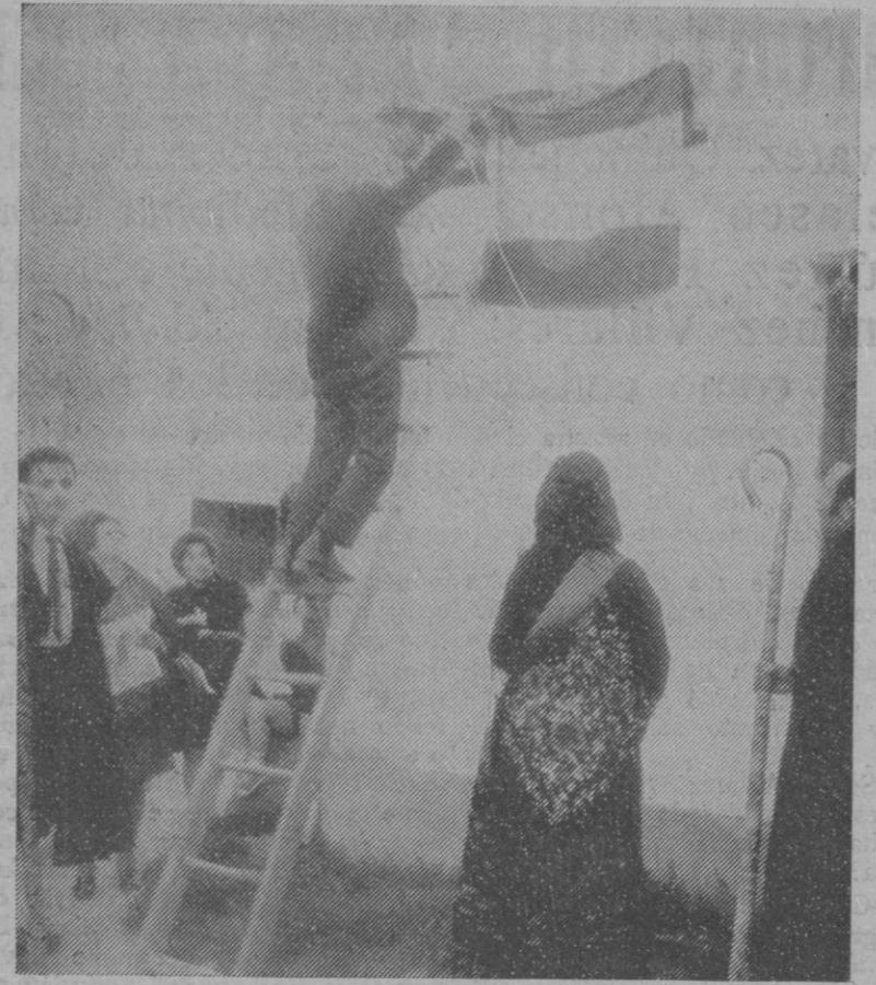
La cuerda hizo «la faena». Fue la nota anecdótica. Y un amable voluntario deshizo «el entuerto». La Mayorala espera el momento de descubrir la placa

Reza así el estribillo del romance que desde tiempo inmemorial se canta en Sotosalbos. Romance ingenuo, sencillo, eminentemente popular, con aires