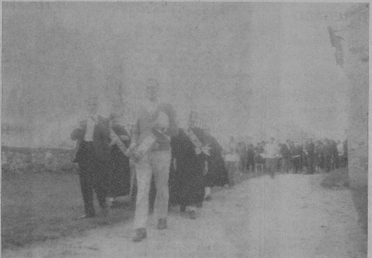
El cortejo se pone en movimiento; acaba de terminar la proclamación de la Mayorala y sus Zagalas y se camina hacia el lugar donde se descubrirá la placa de la «Ruta del Arcipreste»