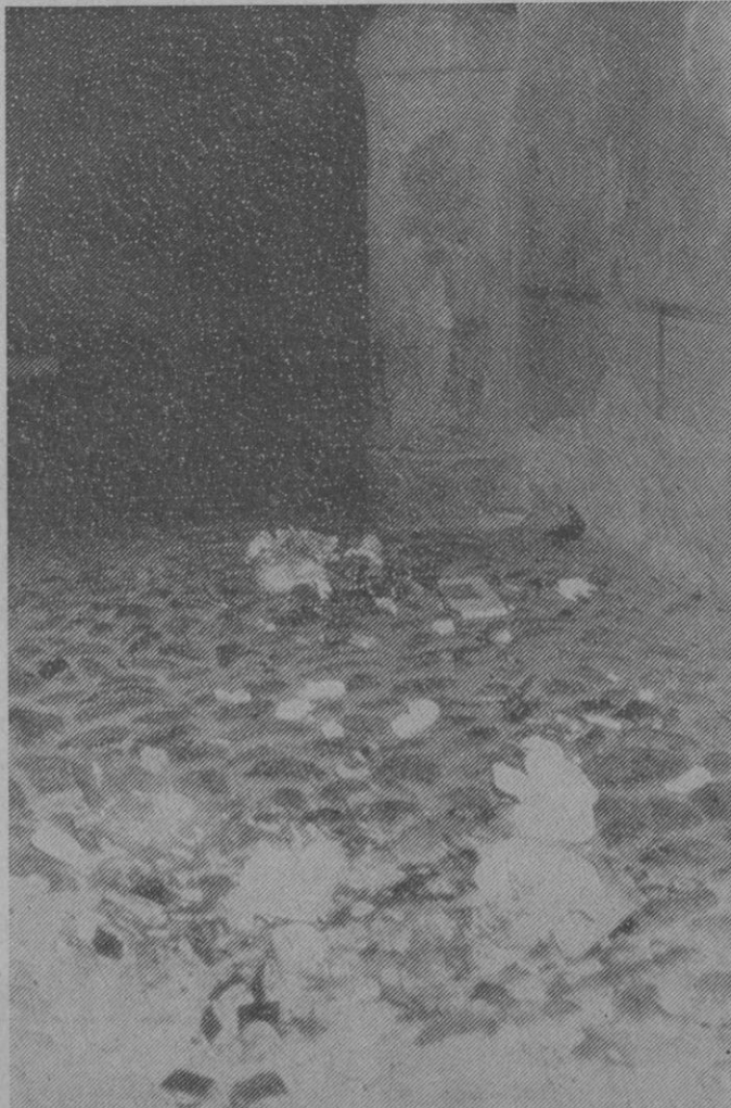
Algo que debe desaparecer: las basuras en las calles