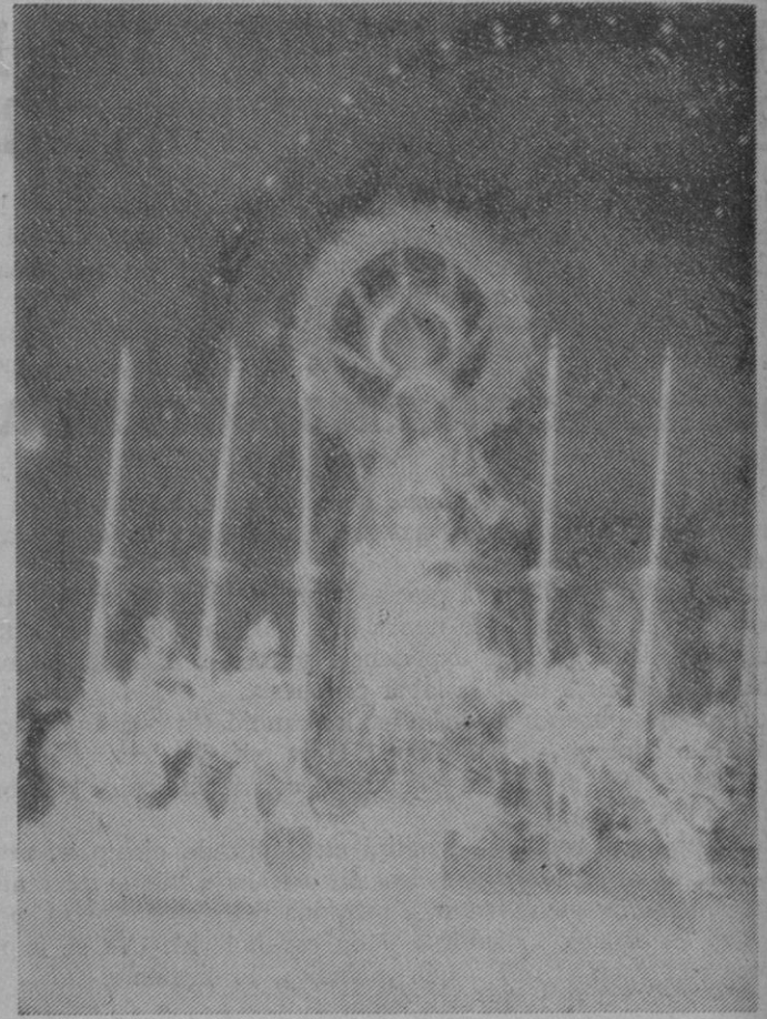
Imagen de Nuestra Señora la Virgen de la Peña

Ha sido su retablo barroco quien me las ha traído al magín. Es posible que más de un lector se escandalice de que en una formidable iglesia románica, de grandiosa bóveda de cañón y ya florida escultura en su portada y otros rincones, sea un retablo dorado y con las consabidas uvas y hojas churriguerescamente salientes en sus columnas retorcidas, lo que haya atraído mi atención más meditadora. Pero ha sido así y un mucho, lo confieso, porque yo también participaba cuando más frecuentes podían ser mis contactos con el templo, de ese menosprecio del tal barroco estilo, tan común en nuestro país, y que quisiera contribuir a desterrar, ante todo por lo que de siniestro puede tener para la conservación de nuestro patrimonio artístico, de que bien legítima parte forma aquél. Mi gran paisano Emiliano Barral, estudiando el barroco en Italia, se alejó de él, definiéndolo como una carga pesadísima que conti-