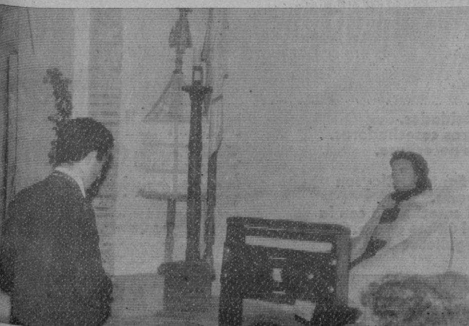
El grupo estudio del Teatro Medieval Popular representó algunos romances. He aquí una escena.

Como la anécdota se produce en el momento menos esperado, aquí también surgió. La Mayorala se aproximó a la fachada del edificio dispuesta a descender la bandera con los colores nacionales que ocultaba la placa; el cordón dijo «no», y un buen hombre, servicial, buscó una escalera de mano y deshizo el nudo que impedía el corrimiento de la tela. Al fin, la inscripción quedó al descubierto, mientras los presentes aplaudían, y el señor Alpens pronunció unas breves palabras recordando que por aquí—y no por tierras de una provincia cercana—pasa la auténtica ruta del arcipreste, que fue instaurada precisamente por el hoy director general de Bellas Artes, señor Pérez Villanueva, durante su mandato como gobernador civil de la provincia.