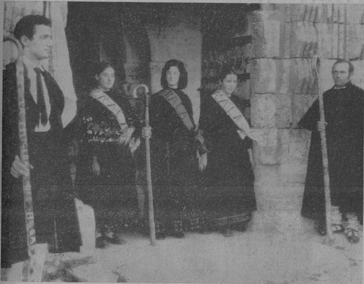
La Mayorala, con sus Zagalas, en el pórtico de la iglesia, momentos después de recibir las bandas

locado en medio de un atractivo paisaje, recibe al año un número muy elevado de visitantes. Algunos, enamorados de la sencillez del pueblo, de la paz bucólica de sus inmediaciones, han adquirido pequeños y viejos edificios, incluso algún molino de las inmediaciones. Y no puede extrañar, por tanto, que estos días Sotosalbos haya recibido la visita de numerosos forasteros, de nuestra ciudad y de Madrid, de donde ha llegado también un buen número para asistir a algunos de los actos que se han venido celebrando.