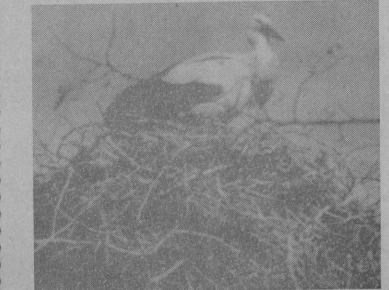
También las aves necesitan protección. Tienen su papel importante en el medio ambiente

Esta situación se manifiesta en que nuestro desarrollo ha provocado el nacimiento de áreas de gran concentración urbana, y es fácil distinguir entre provincias receptoras de población y las que, como la nuestra, se vacían. Estas grandes concentraciones