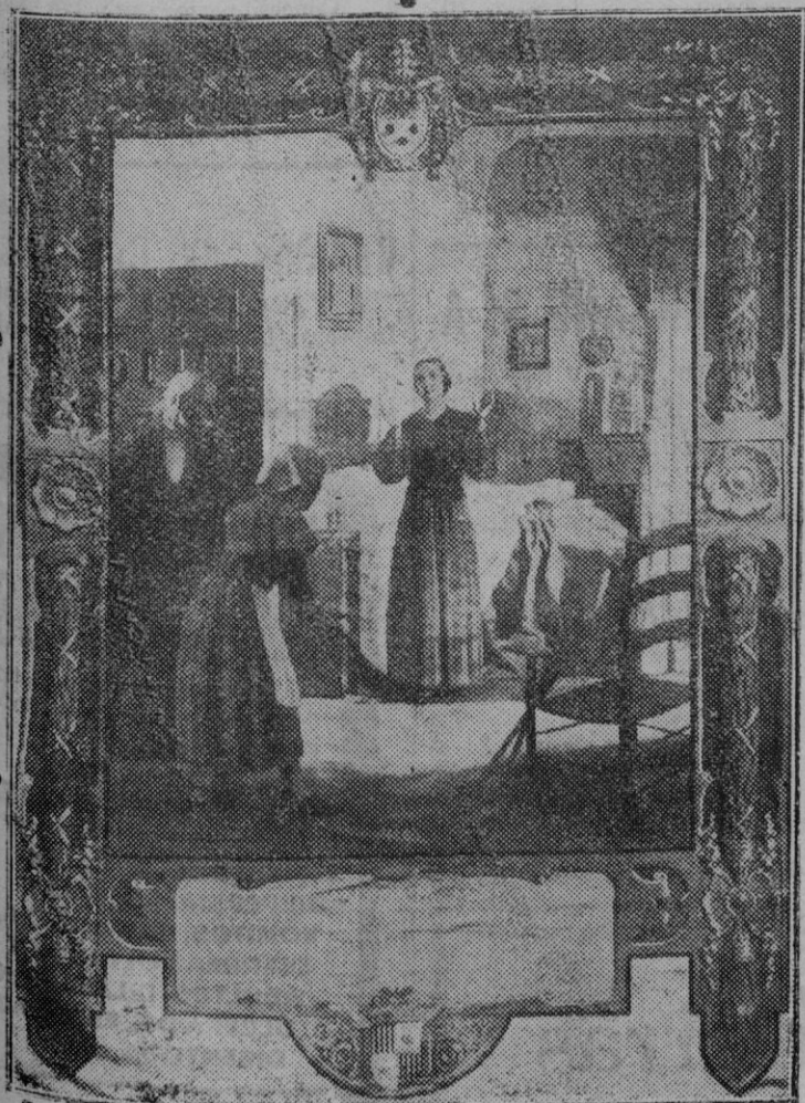
Estandarte representando la milagrosa curación de María Antonia Matheu y Coll que se exhibía en el interior de la Basílica de San Pedro en la fiesta de la Canonización de Santa Catalina Thomás.

Con autorización del Excmo. Sr. Arzobispo - Obispo de Mallorca, se ha iniciado una suscripción mensual destinada a los fines del citado Asilo de niños y a la cual es de esperar se asociarán todas las personas caritativas.