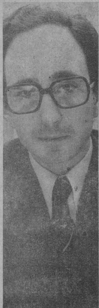
«Relaciones Culturales acogió desde el primer momento, con todo entusiasmo, la idea de preparar esta exposición»