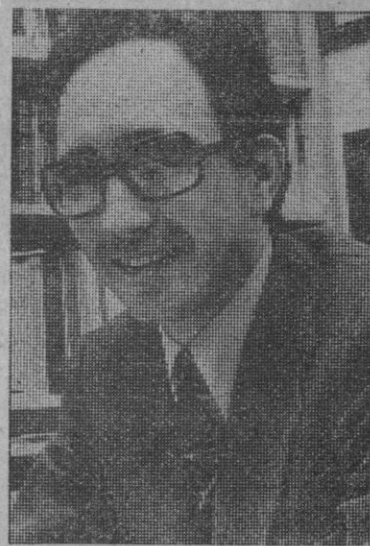
«Naturalmente que vendrá a Segovia; será exhibida en el mes de julio»