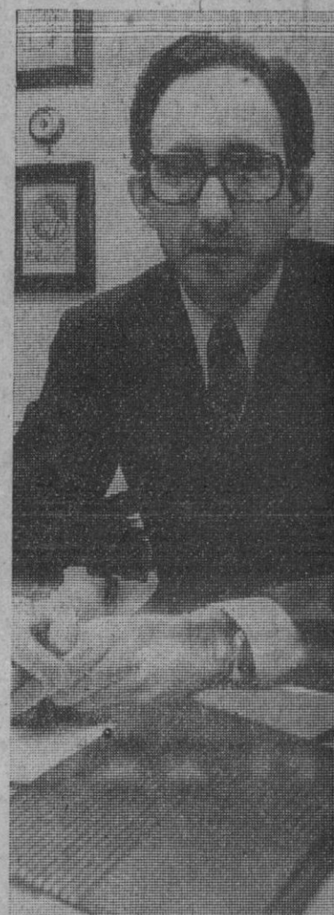
«La exposición tiene una triple misión que cumplir»