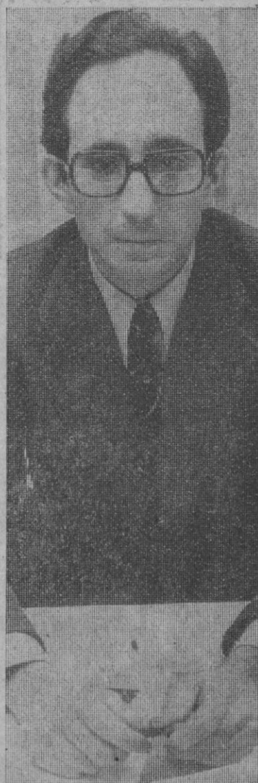
«Desde París, la exposición se instalará en Roma, Munich y Londres»