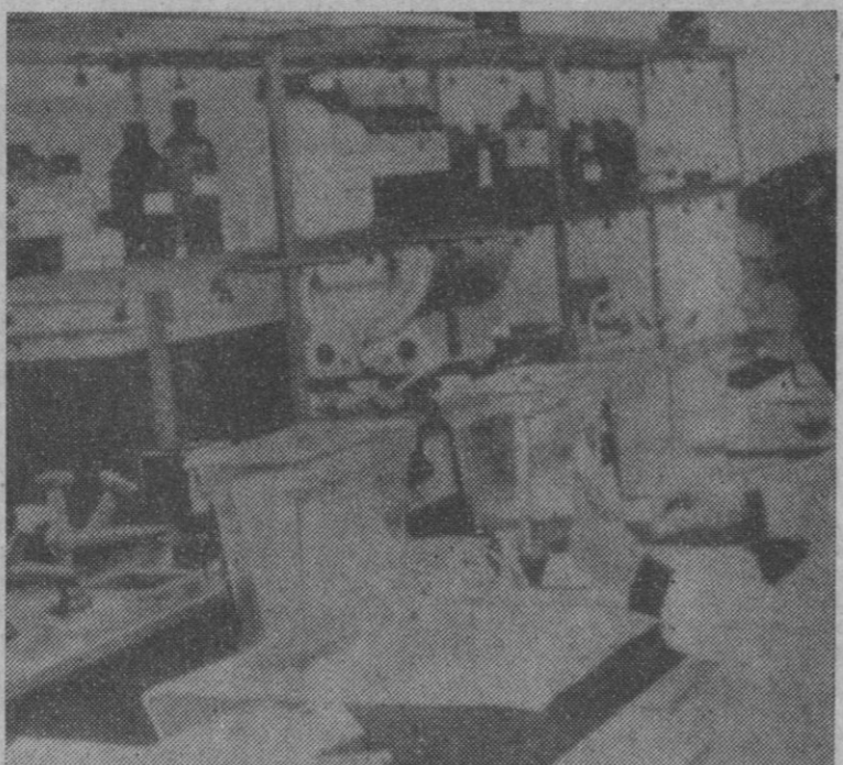
El Presidente del Gobierno, señor Arias Navarro, acompañado del vicepresidente tercero y ministro de Trabajo, señor De la Fuente, inauguró hoy, en Madrid, las instalaciones de los Servicios Centrales, Instituto Territorial y Gabinete Técnico Provincial del Plan Nacional de Higiene y Seguridad del Trabajo. En el nuevo centro podrán realizarse 400 reconocimientos diarios. Será totalmente terminado en 1975 y supondrá un coste total de 4.500 millones de pesetas

En primer lugar se procedió a la bendición de las instalaciones y al descubrimiento de una lápida conmemorativa del acto, por parte del presidente del Gobierno. Después tuvo lugar un acto en el salón dedicado al efecto en el que pronunciaron sendos discursos el ministro de trabajo y el presidente del Gobierno.—Cifra.