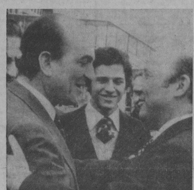
El ministro de Industria, don Alfredo Santos Blanco, ha regresado a Madrid, finalizado su viaje a Irak, en donde ha conseguido la compra de 28 millones de toneladas de petróleo de aquí al año 1979. En Barajas fue recibido por el ministro de Obras Públicas, don Antonio Valdés