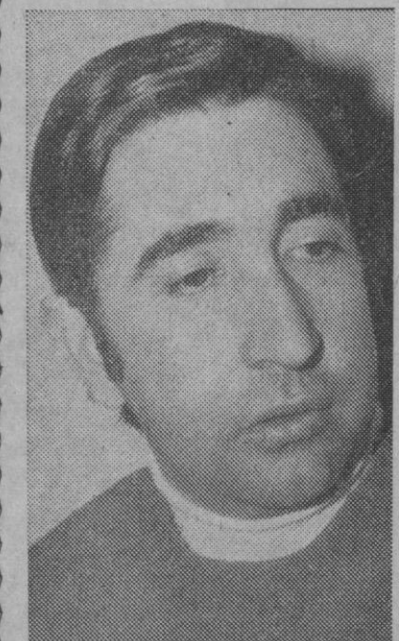
«Voy a ver si consigo ganar este año el Campeonato de España de fórmula 1.430»

Madrid, 23.—Medio millón de pesetas ha sido el botín obtenido por tres individuos que esta mañana atracaron una entidad crediticia de la calle de Nuestra Señora de Valvanera, en el madrileño barrio de Carabanchel.—Cifra.