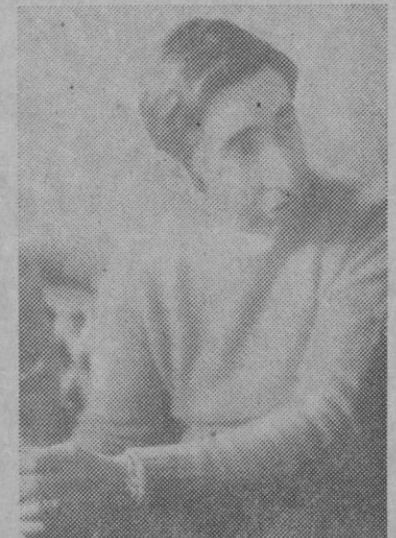
«Pronto voy a inaugurar un automercado de coches en nuestra ciudad.»

grupo II, también con «Viorna» y sobre «BMW». Son doscientos caballos los que debe dominar con el volante. Pero surgen algunas complicaciones con los patrocinadores, que objetan que en estas pruebas la publicidad «no se ve». Entonces, Rafael se «trasplanta» a la fórmula 1.430, para hacer cuatro o cinco carreras al año. Acude a varios cir-