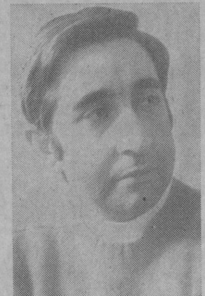
«Estoy totalmente recuperado del gravísimo accidente que sufrí en Segovia, el año pasado»

Debuta en la subida a la Bastida, en Toledo, y se clasifica en el puesto 21 entre un lote de 45 pilotos. El hecho de haber podido participar y de haber llegado a la meta—quizá haciendo verdad la máxima de Coubertin—le anima a seguir. Se da cuenta que precisa cambiar de vehículo y se hace con un «Matra», que le supone un desembolso de más de 200.000 pesetas. Pero el cambio sale mal, porque el motor del presunto bólido «no va». Sólo