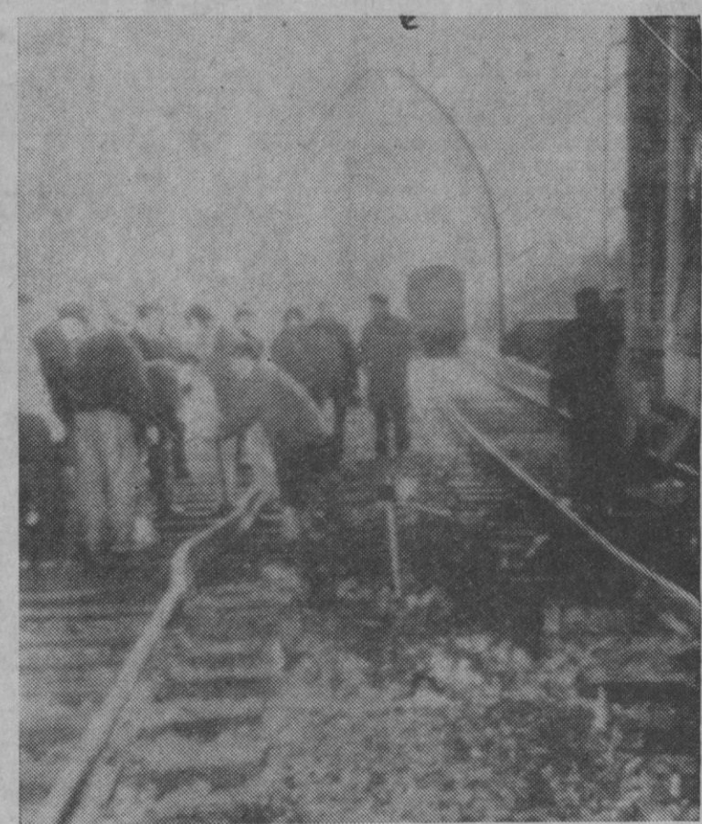
En las cercanías de la frontera española con Francia se ha producido un atentado a la vía férrea, del que se confiesa autor el Grupo Autónomo Vasco. En la fotografía, momento en que los técnicos inspeccionan los daños causados