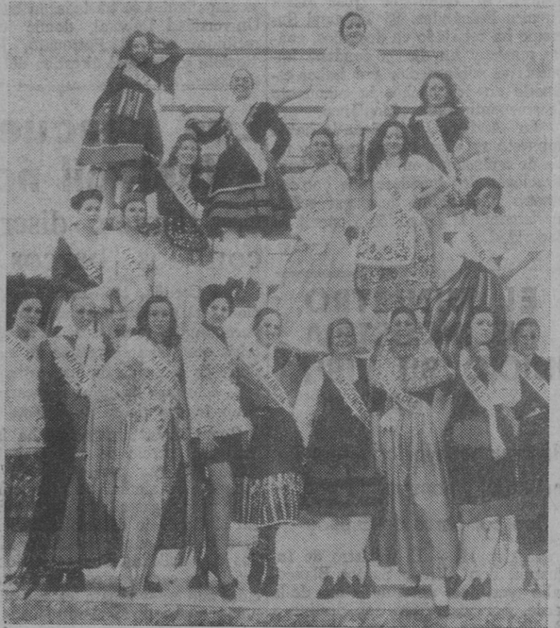
El grupo de las jóvenes que tomaron parte en el certamen del año pasado

Ya han empezado las selecciones previas, en todo el territorio nacional, para elegir a las veinte jóvenes representantes que aspiran al título de Maja de España 1974. Esta selección se está llevando a cabo a través de los medios de difusión locales más importantes que tienen a su cargo las elecciones regionales o de zona, en su calidad de concesionarios exclusivos.