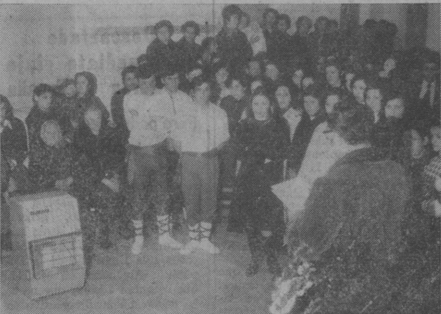
Un momento del acto de clausura de la cátedra de Sección Femenina

Las Estaciones de Invierno de La Savoie (Chamonix, Courchevel, Val d'Isere etc).