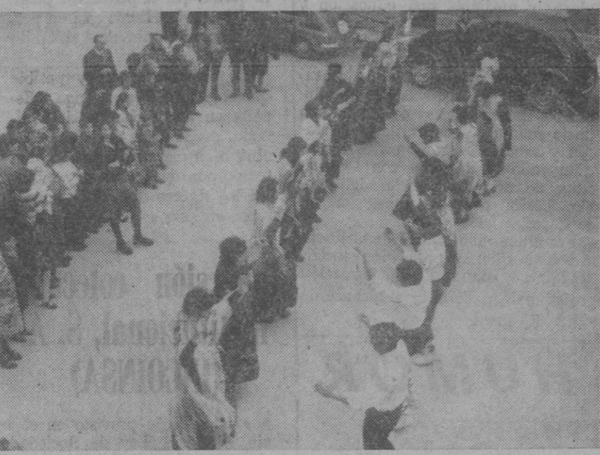
Tras la clausura de la cátedra, exhibición de bailes típicos