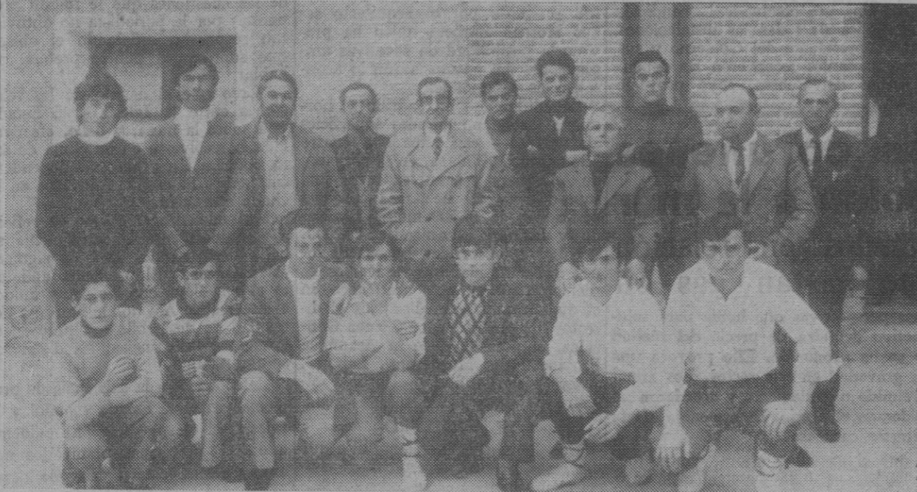
Los alumnos del curso del P. P. O. posan junto a los profesores del mismo

Ambos actos, desarrollados conjuntamente, fueron presididos por los delegados provinciales de Trabajo e Información y Turismo, acompañados de diversas jerarquías provinciales, mandos de Sección Femenina y autoridades locales.