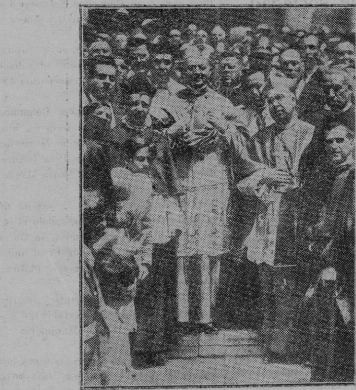
Málaga. — El Nuncio de Su Santidad Monseñor Tedeschini, al salir con el obispo de Tuy, cuya consagración se celebró solemnemente en la Basílica malagueña.

Día 19.—Fiesta del SS. Corpus Christi.—A las diez, exposición del