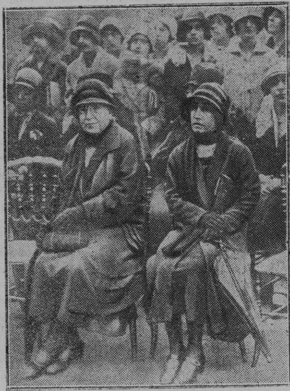
París. — La esposa del Mariscal Foch durante la ceremonia de inauguración de una lápida conmemorativa colocada sobre la casa que habitaba el Mariscal, en la Avenida de Saxe, el día que se firmó el armisticio.

A las seis de la tarde.—Bailes regionales por parejas vestidas con el traje típico de Mallorca y amenizado por gaita y tamboril, en la terraza anterior del Hotel.