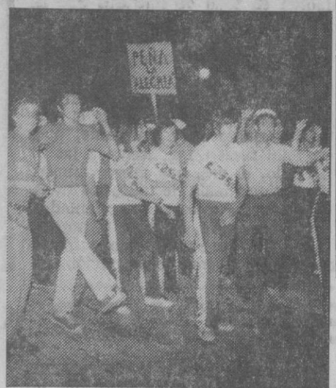
En la fotografía, la reina de las fiestas y sus damas. En las inferiores, el delegado de Información y Turismo leyendo el pregón y varios miembros de una de las peñas durante el desfile.

Anoche, Ayllón—un entrañable pueblo segoviano que no por alejado de la capital es menos querido—puso el preámbulo de sus fiestas en honor de San Miguel Arcángel. La plaza mayor y el balcón suggestivo de su Ayuntamiento fue el marco risueño a unos actos que durante tres días han de poner en alto en el cotidiano laborar de una comunidad con más bajo índice de emigración. Las tierras rojizas de Ayllón brillaron más y la "Martina" turbó al chasquido del primer cohete. Ayllón, ayer, ponía con alegría y esperanza un pórtico feliz a unas interesantes fiestas que van siendo ya de las más tradicionales de la provincia.