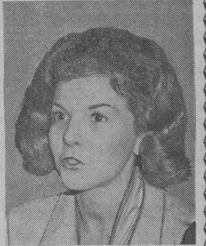
El teniente general Juan Domingo Perón y su esposa, Isabel Martínez de Perón, que en aplastante victoria electoral han resultado elegidos presidente y vicepresidente, respectivamente, de la República Argentina.