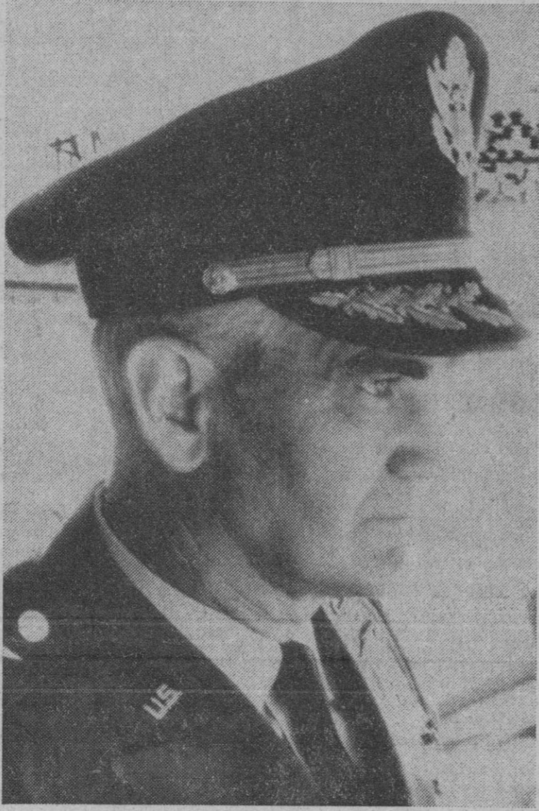
El general norteamericano Westmoreland, iniciador de la guerra electrónica, predijo para 1980 campos de batalla de autómatas