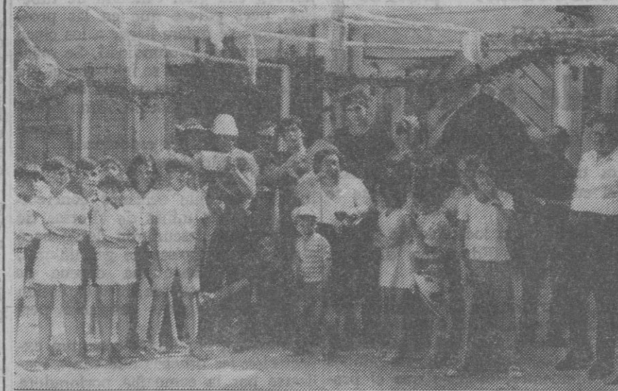
La «madrina» de la «peña» de los casados posa, con su peso, junto a los representantes de otras. Hay alegría colectiva, generosamente regada con la limonada.

El barrio de San Lorenzo "arde" en festejos populares. El lunes comienzan en la villa de El Espinar