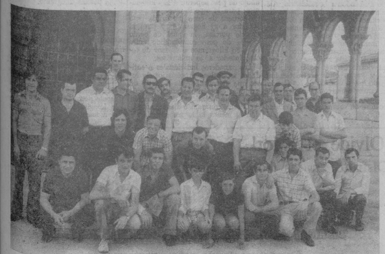
He aquí al grupo de cocineros y ayudantes que esta mañana ha asistido, en la iglesia de San Lorenzo, a una misa en honor del santo, al que tienen por Patrono. Luego, se han reunido en el acostumbrado desayunado. El grupo ha aumentado este año. Junto a caras veteranas y muy conocidas, la juventud va ocupando un puesto importante. Es posible que para otro año se haya incrementado todavía más el grupo e incluso pueda ampliar los actos.