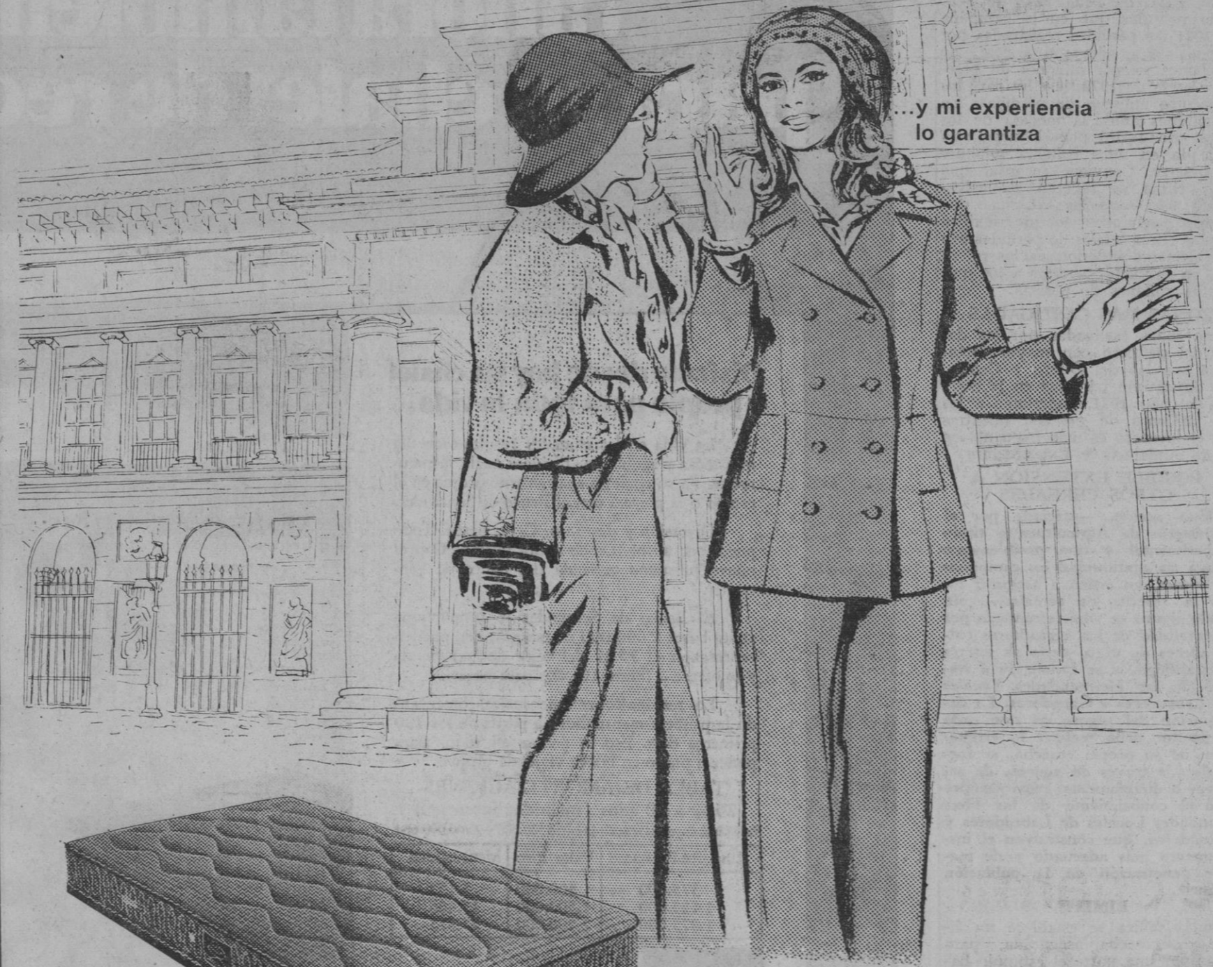
...y mi experiencia lo garantiza

Esta es la primera vez que visitamos España y estamos francamente contentas de todo cuanto hemos visto. Hemos recorrido el país de punta a punta, y nuestra admiración y sorpresa ha sido tan grande que apenas nos hemos dado cuenta del cansancio. Debe ser porque los hoteles donde hemos dormido tienen colchones como el sol de España, ¡lo mejor del mundo! colchones de muelles sin nudos. Puedo asegurarles que en la industria de colchones, con la marca FLEX no tienen ustedes que envidiar a nadie.