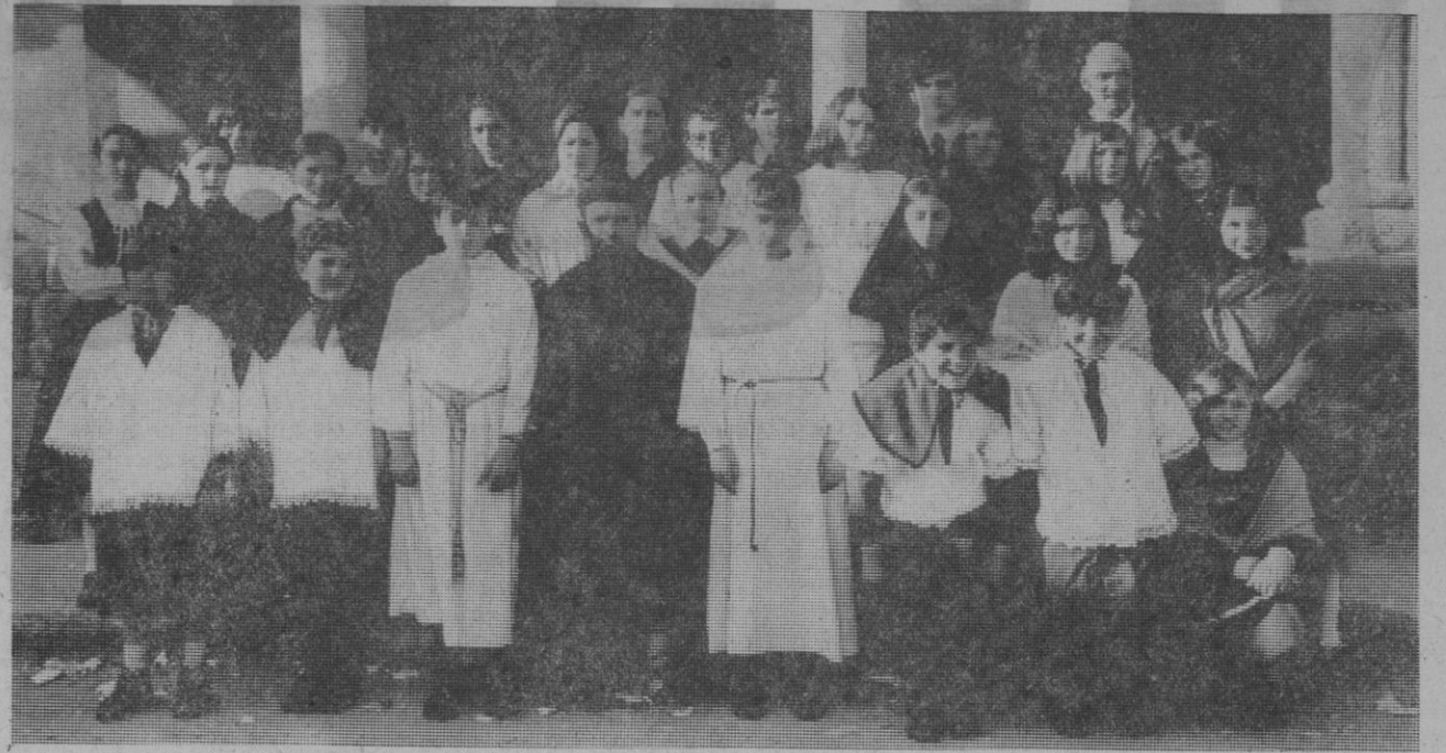
Ayer tarde, en la iglesia parroquial de San Lorenzo, el grupo-estudio de Teatro Medieval Popular de Eurolenguas ofreció una rememoración de la Pasión que ya el anterior domingo había presentado en Sotosalbos. Se representaron, sobre el mencionado tema, romances segovianos y tres bellas obras teatrales medievales, una de ellas de Gómez Manrique y otras dos anónimas de los siglos XIII y XV. En el grabado, el grupo de actores con su director.