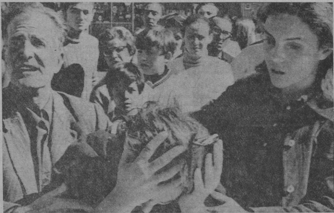
Durante los trabajos de rescate, se produjeron escenas de viva emoción—como la que recoge la fotografía—entre los familiares de los obreros que habían quedado sepultados