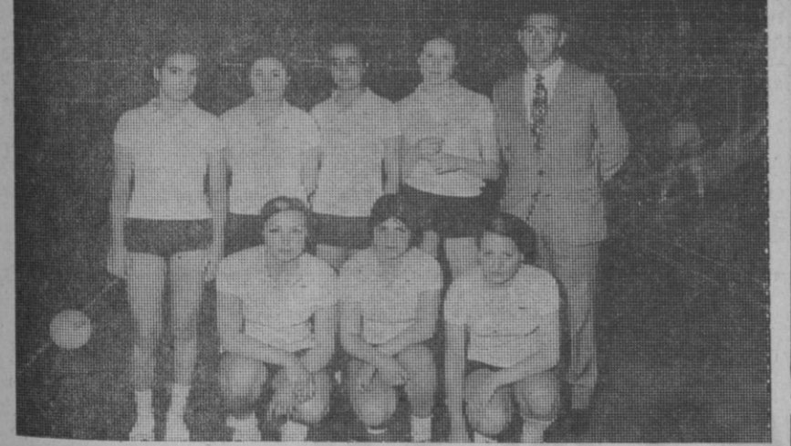
Equipo segoviano del Medina.

En la tarde del sábado y en el pabellón deportivo "Enrique Serichol" comenzaron los encuentros de la fase de sector para el ascenso a la Segunda División Nacional Femenina de voleibol con la participación de los siguientes equipos: