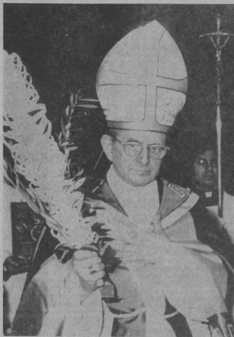
Ciudad del Vaticano.—Su Santidad el Papa Pablo VI camina en procesión con una palma por la basílica de San Pedro durante la celebración del Domingo de Ramos. En una charla sobre la entrada de Jesús en Jerusalén, Su Santidad dijo que la contestación y la rebelión no eran los caminos para cambiar el mundo.—(Telefoto Europa Press)