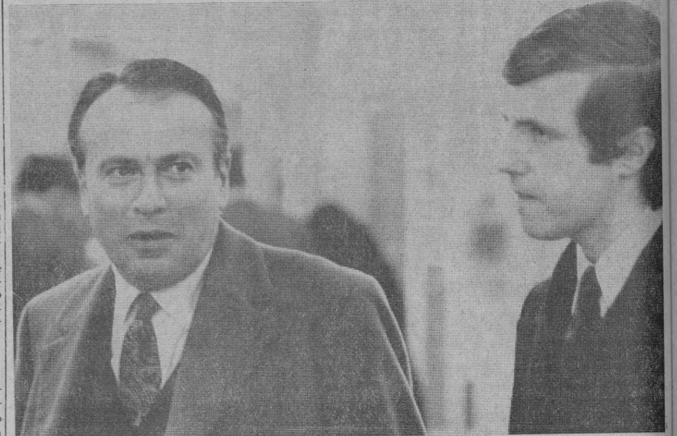
Un acontecimiento musical en estos momentos es el descubrimiento del «Tercer concierto», de Paganini, de maestro Henryk Szeryng. A su llegada a Madrid ensayó con la orquesta de Radio y Televisión y después, con este mismo acompañamiento, interpretó entre otras obras, el ya citado concierto y el «concierto en la menor», de Bach, con un gran éxito de público. En la fotografía el maestro Szeryng, a la izquierda, a su llegada a Madrid

Madrid, 18.—Procedente de Nueva York, llegó ayer a Madrid el escritor húngaro Lajos Zilahy. Zilahy, que desde hace muchos años se afincó en los Estados Unidos, disfrutará en España de unos días de descanso.—Cifra.