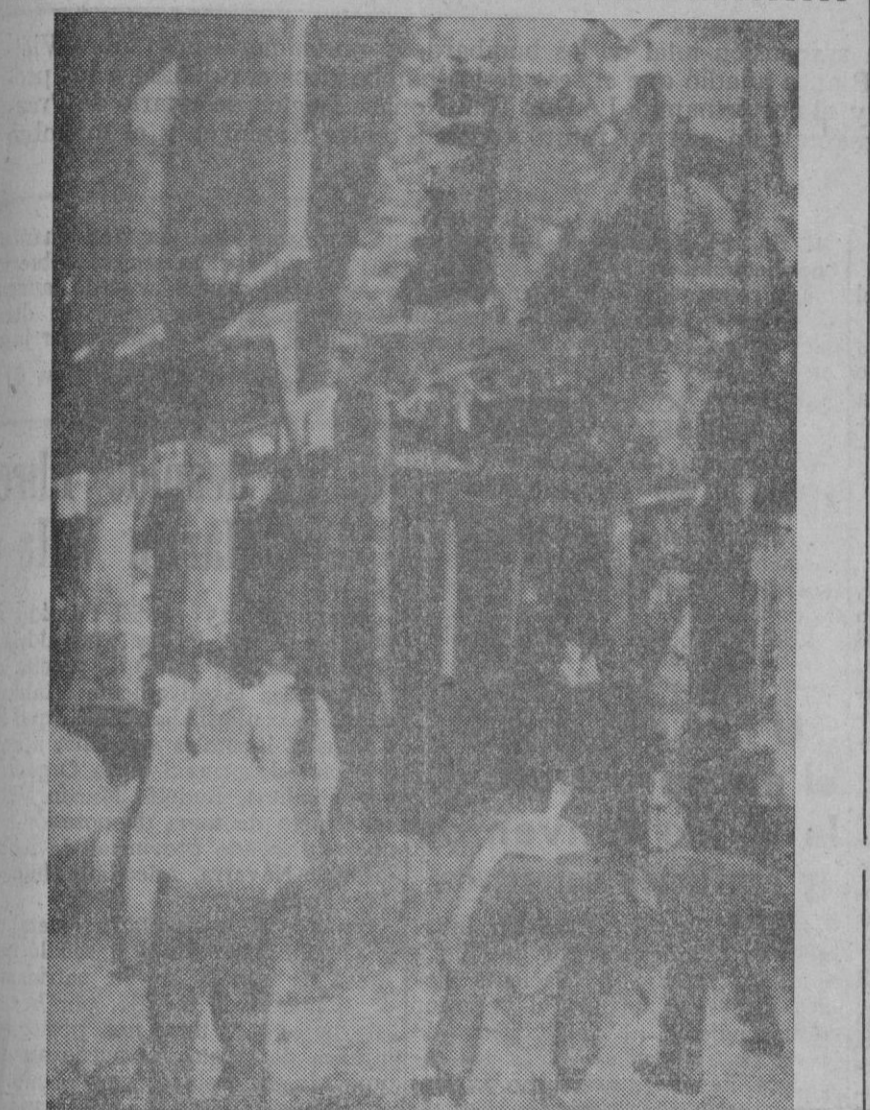
Nuevo atentado contra el barrio católico de Belfast, la castigada capital del Ulster. Esta vez la bomba destruyó un bar e hirió a diecisiete personas. Los daños, como podemos observar, fueron considerables.