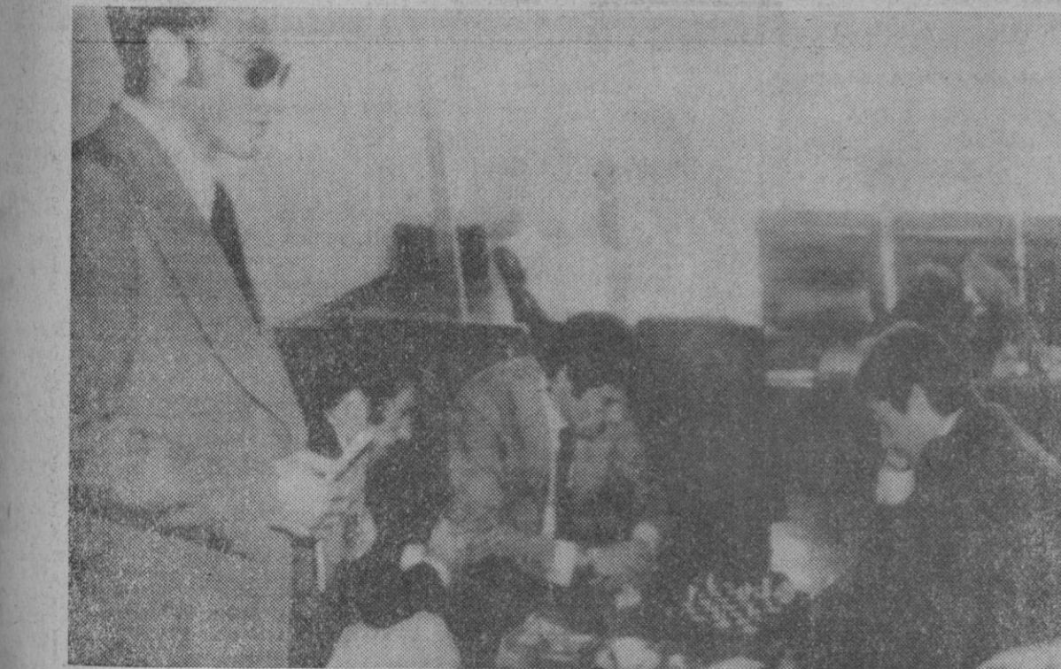
La selección española de fútbol se encuentra en Grecia para disputar el primero de sus partidos con la selección helena para la clasificación en el Campeonato Mundial de Fútbol. Sobre estas líneas aparecen algunos de los componentes del conjunto español jugando al ajedrez mientras esperan en Barcelona la salida del avión que les llevará a Atenas.

París, 16.—El jefe de la casa de Borbón-Dos Sicilias y nieto del último rey de Nápoles, príncipe Raniero de Borbón, de 90 años, falleció hoy en su residencia de Roquebrune-sur-Argens, en el sureste de Francia.