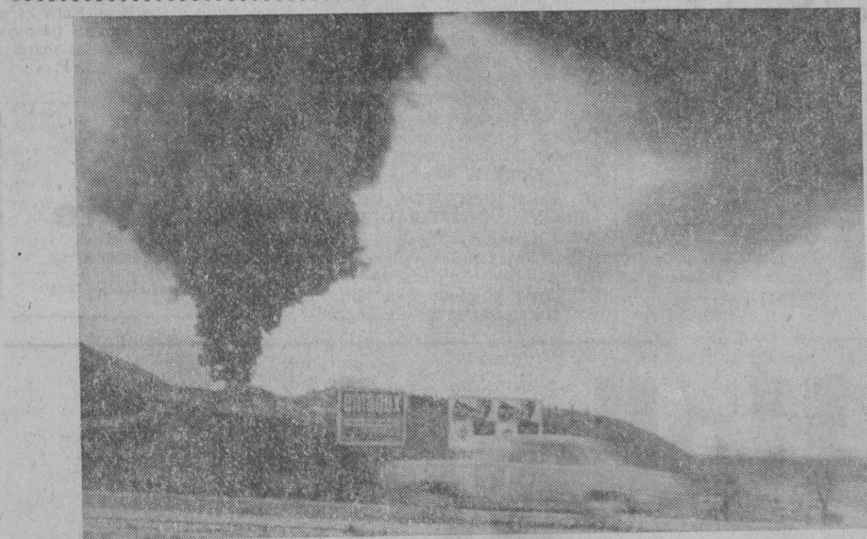
El cielo claro de Castilla que cantó el poeta poco tiene que ver con esta estampa. La enorme humareda procede de la combustión de desperdicios ciudadanos, operación que se realiza en el término de San Fernando de Henares. El sistema, hasta que sea trastocado por otro más acorde con los tiempos que vivimos, constituye una forma más de contaminar nuestra atmósfera.