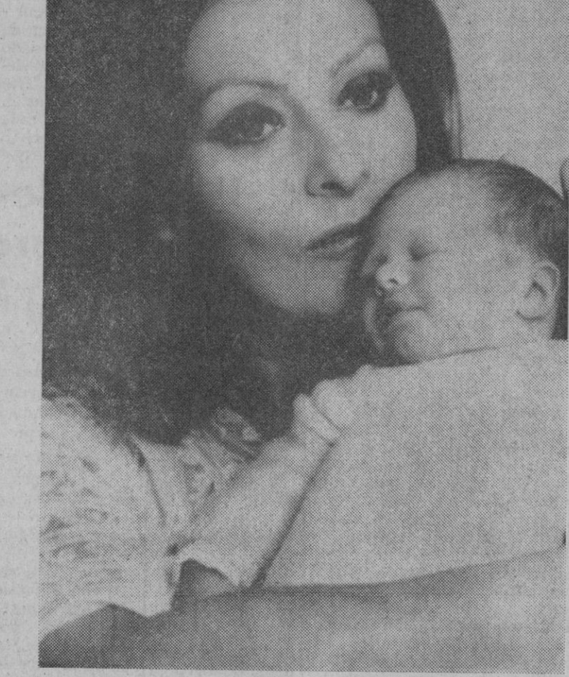
Roma.—Sofía Loren fotografiada con su hijo Eduardo en la habitación del hospital de Ginebra. La foto fue distribuida hoy en Roma.—(Telefoto AP-Europa Press)