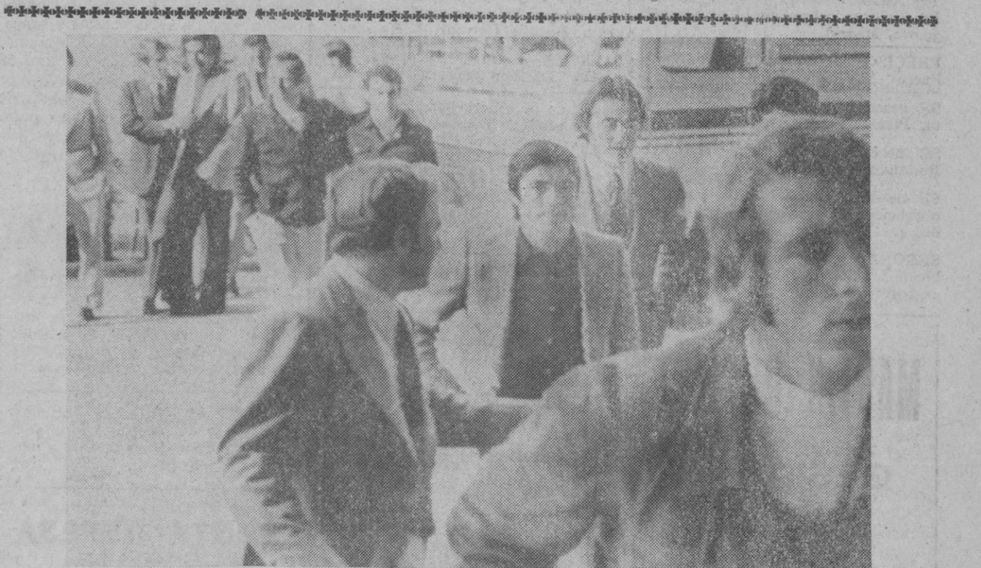
Barcelona.—A las órdenes del seleccionador nacional del fútbol, Ladislao Kubala, empezó a trabajar la selección en el estadio azulgrana, donde efectuaron masaje, reconocimiento médico y sauna; mañana comendrán con los entrenamientos.

Barcelona, 10.—El mercado bursátil barcelonés ha seguido manifestándose firme pero sin la potencia de los últimos días. Y no ha sido precisamente por falta de compradores, ya que la demanda subsistía claramente, pero el factor realización de beneficios es posible que haya empezado a funcionar hoy y, en consecuencia, el dinero ha encontrado contrapartida con mucha más facilidad. En resumen, la jornada ha sido positiva con ligeras flexiones y el cierre quedaba bastante equilibrado, aunque si algo sobrepasaba era todavía alguna demanda.—Cifra.