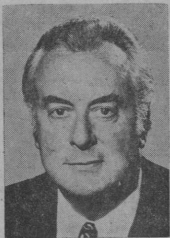
Gough Whitlam, líder del partido laborista australiano, que ha logrado una gran victoria en las recientes elecciones y pasa a ser el primer ministro del país