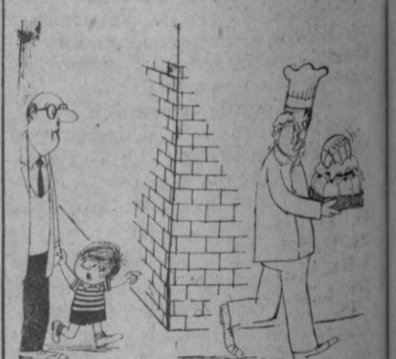
—Es él, que no quiere devolverme el balón.

¡¡VISTA GRATIS!! con cheques-compra Salón de Modas