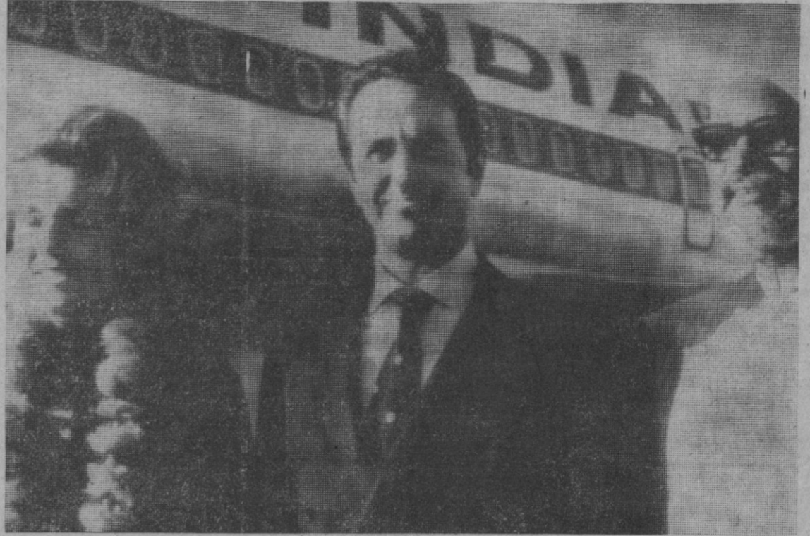
Nueva Delhi—El ministro español de Asuntos Exteriores, don Gregorio López Bravo, con su esposa, a su llegada al aeropuerto de Nueva Delhi, para una visita de una semana de duración.