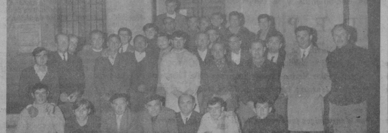
Cursos organizados por la Gerencia Provincial de Promoción Profesional Obrera (P. P. O.) se han celebrado en Ortigosa del Monte—de vacuno lechero—y en Cabezuela—de cultivos—. Ambos cursos han sido clausurados. En el grabado superior aparecen los asistentes al curso de Ortigosa y en el inferior, los del desarrollado en Cabezuela.