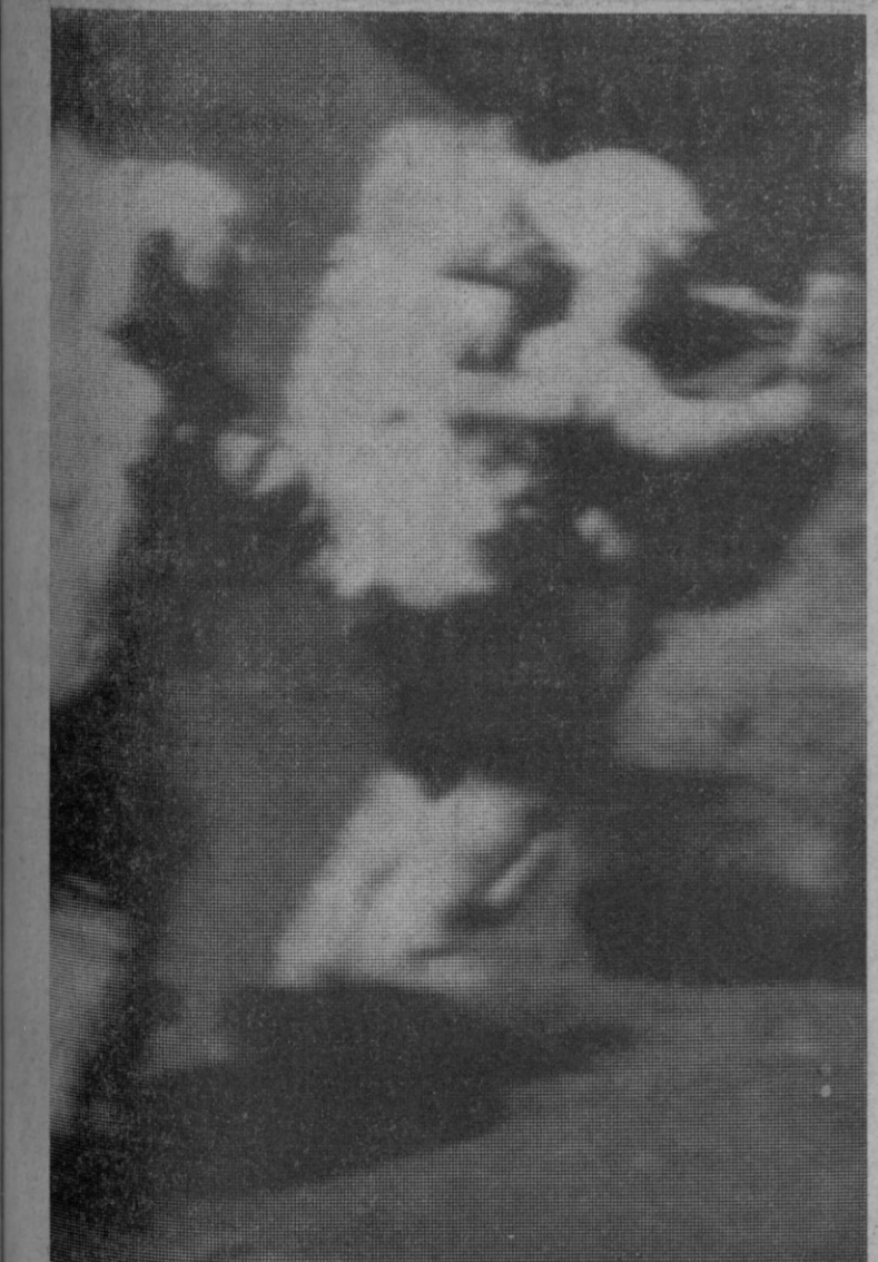
Eugene Cernan excava en una roca lunar, para obtener muestras de piedras lunares y es observado por su compañero Schmitt, durante su tercero y último día en la Luna.

Índice general de la sesión: 132,77 contra 132,57.—Cifra.