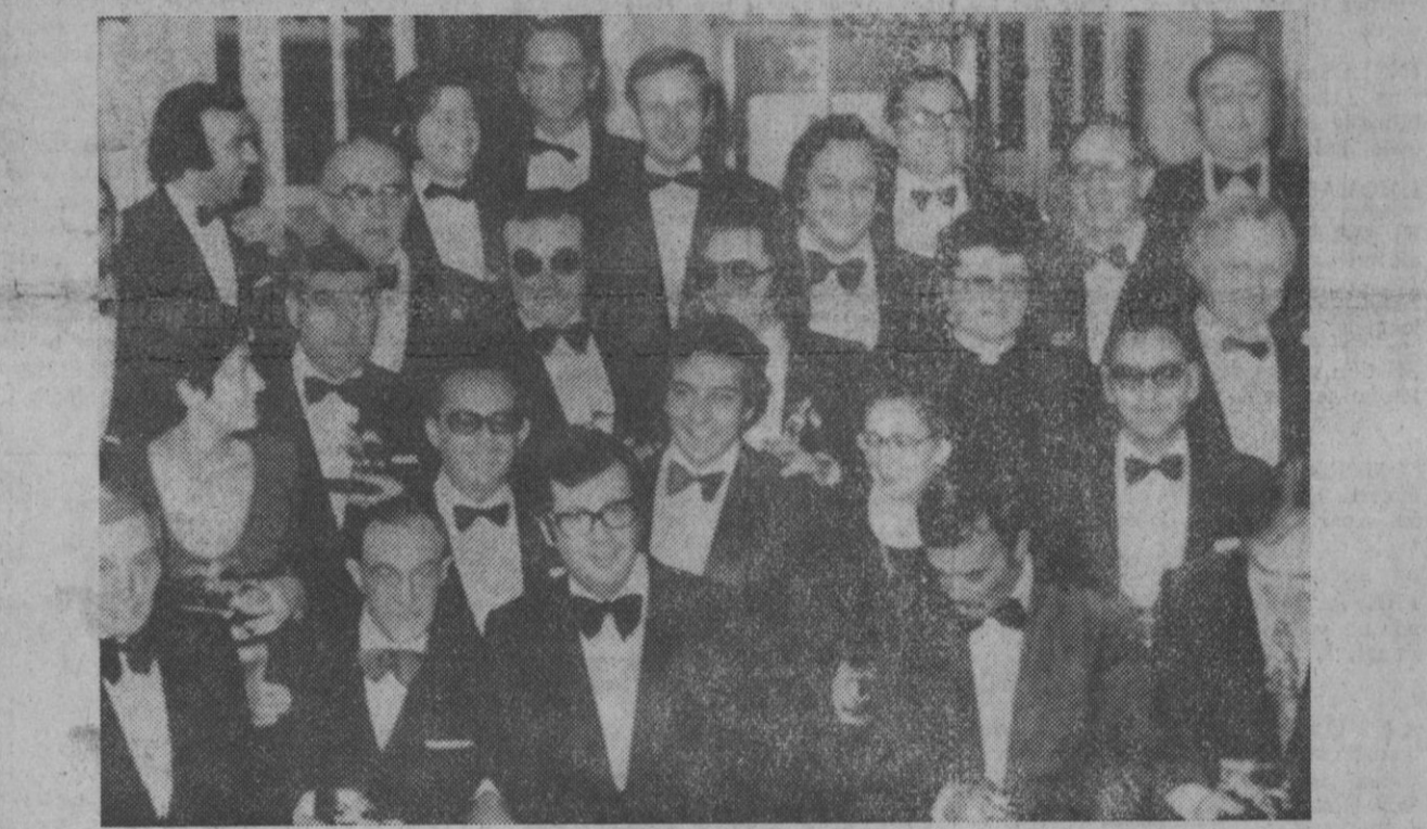
Barcelona.—Algunos de los galardonados con el premio Ondas posan para los reporteros gráficos al final de la gala celebrada en el hotel Ritz de la Ciudad Condal.

que trae Cámpora le permitirá a Perón, sin lugar a dudas, calibrar con la mayor exactitud posible sus inmediatas maniobras tácticas a los efectos de que su regreso —ya faltan menos de 48 horas— se concrete con total éxito.