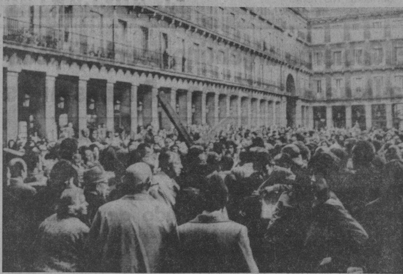
Madrid.—Varios cientos de personas se congregaron en la plaza Mayor para escuchar a Arthur Blessitt, el norteamericano que, con una cruz a cuestas, ha recorrido casi 20.000 kilómetros por el mundo predicando el amor cristiano según su punto de vista. A los pocos minutos, la Policía Armada disolvió la concentración, aunque la gente permaneció bajo los soportales observando cómo era detenido el predicador.

El portavoz del Departamento de Estado dijo esta mañana que durante el día de hoy se esperaba saber por qué no se quedaron en La Habana los secuestradores en su primera escapada. Y añadió que el Gobierno de los Estados Unidos solicitaría la extradición de los aeropiratas, que consiguieron como rescate dos millones de dólares de los diez que exigían.—Efe.