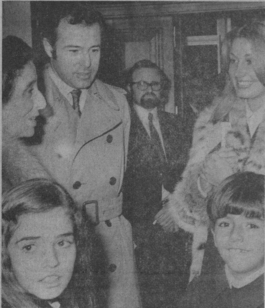
Madrid.—Don Alfonso de Borbón Dampierre y su esposa doña María del Carmen Martínez Bordiú, a su llegada al aeropuerto de Barajas, donde fueron recibidos por la esposa del Jefe del Estado, doña Carmen Polo de Franco, y otros familiares. El motivo del viaje es esperar el feliz alumbramiento de María del Carmen, que quiere tener su hijo en España.

De los casos estudiados resultaron 100 casos de cáncer de pulmón, y eran fumadores según la conclusión. «Se llegó a la conclusión de que el cáncer bronquial tuvo cuarenta veces más posibilidades de desarrollarse en los pacientes que fumaron veinte cigarrillos al día», dice el artículo.