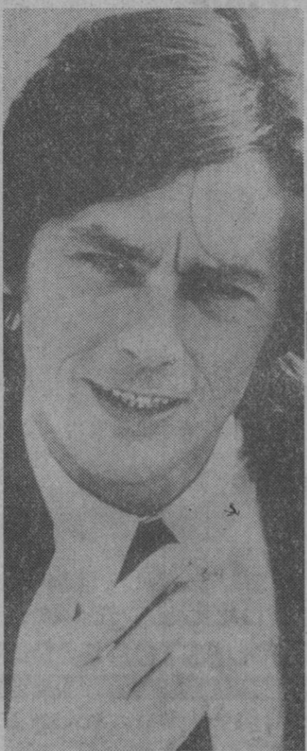
Alain Delon está en gira por todo el mundo, acompañando el estreno de su película «El asesinato de Trotsky». En ella hace el papel de Frank Jackson, el asesino. Es uno de los actores más prestigiosos de Francia. Ahora va a producir una continuación de «Borsalino», pero sin Belmondo; murió en la anterior, dice.

La temeridad no es una cualidad positiva. Trabajador, huye del peligro.