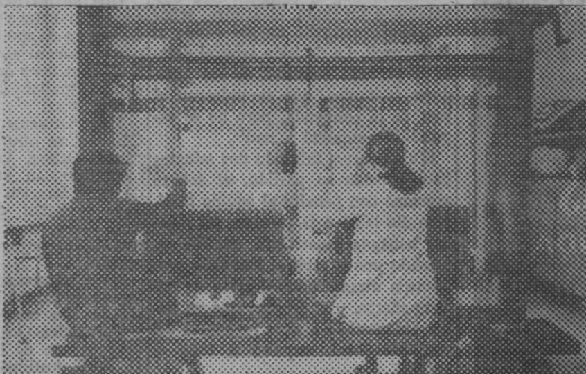
Por ejemplo, este Centro de Subnormales creado por las Cajas de Ahorros con la colaboración de Usted, participa en la tarea de que muchos españoles sean más útiles y felices.

Coloque su dinero en inversiones bien asesoradas. En su Caja de Ahorros hay un Departamento especializado, y en él un equipo de expertos en finanzas cuya misión es informar a Usted y aconsejarle. También, si lo desea, pueden comprar, en su nombre, obligaciones o títulos estimados como más sólidos y rentables. Su Caja se encarga de todos los trámites • Las Cajas de Ahorros Confederadas se distinguen fácilmente. Por que ofrecen: asesoramiento de inversiones, cuentas corrientes, créditos, servicio de intercambio, transferencias, etc., en sus 5.500 Oficinas destinadas sólo a servicios financieros • Por este emblema • Porque su Consejo de Administración trabaja desinteresadamente. Gratis. Y no tienen accionistas. Entonces, sus beneficios no van a bolsillos particulares sino a centros de investigación, clínicos, bibliotecas, premios literarios, campos deportivos, restauraciones artísticas, ... (4.000 millones se destinaron a estas obras el año pasado).