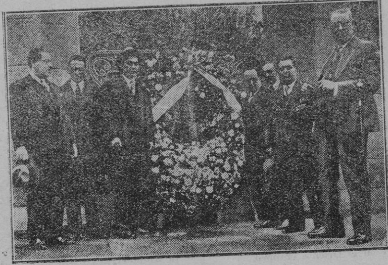
Barcelona. — Los periodistas hispanoamericanos colocando una corona de flores en el monumento del gran poeta catalán Jacinto Verdaguer.

Se aprobó el Padrón del Arbitrio sobre alcantarillado para 1930.