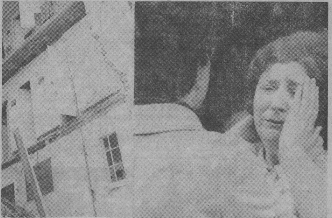
Barcelona.—Dos edificios sitos en la calle de Ladrilleros, del barrio de Sans, sufrieron una pavorosa explosión, al parecer a causa del gas. El suceso ha llenado de dolor y consternación al barrio de Sans y hasta el momento se han retirado 11 muertos y 18 heridos entre los escombros y no se descarta la posibilidad de que existan aún personas sepultadas.