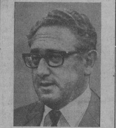
Henry A. Kissinger, consejero especial del Presidente Nixon, y que viene desarrollando una actividad febril con vistas a lograr el final de la guerra de Vietnam

control firme de la zona de tres fronteras en que se unen las de Laos, Camboya y Vietnam del Sur.—Efe.