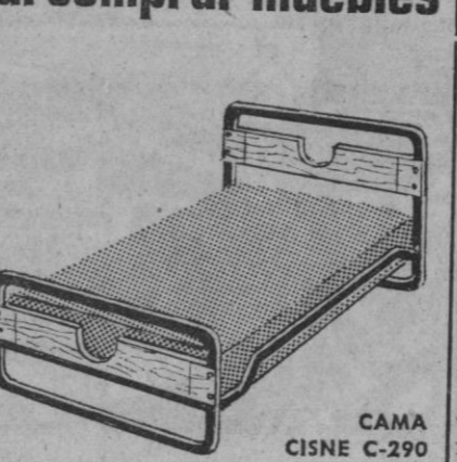
CAMA CISNE C-290

Por la extensa gama que le ofrecemos; por la gran variedad de soluciones; por su garantía de calidad, es conveniente contar con FLEX a la hora de comprar muebles.