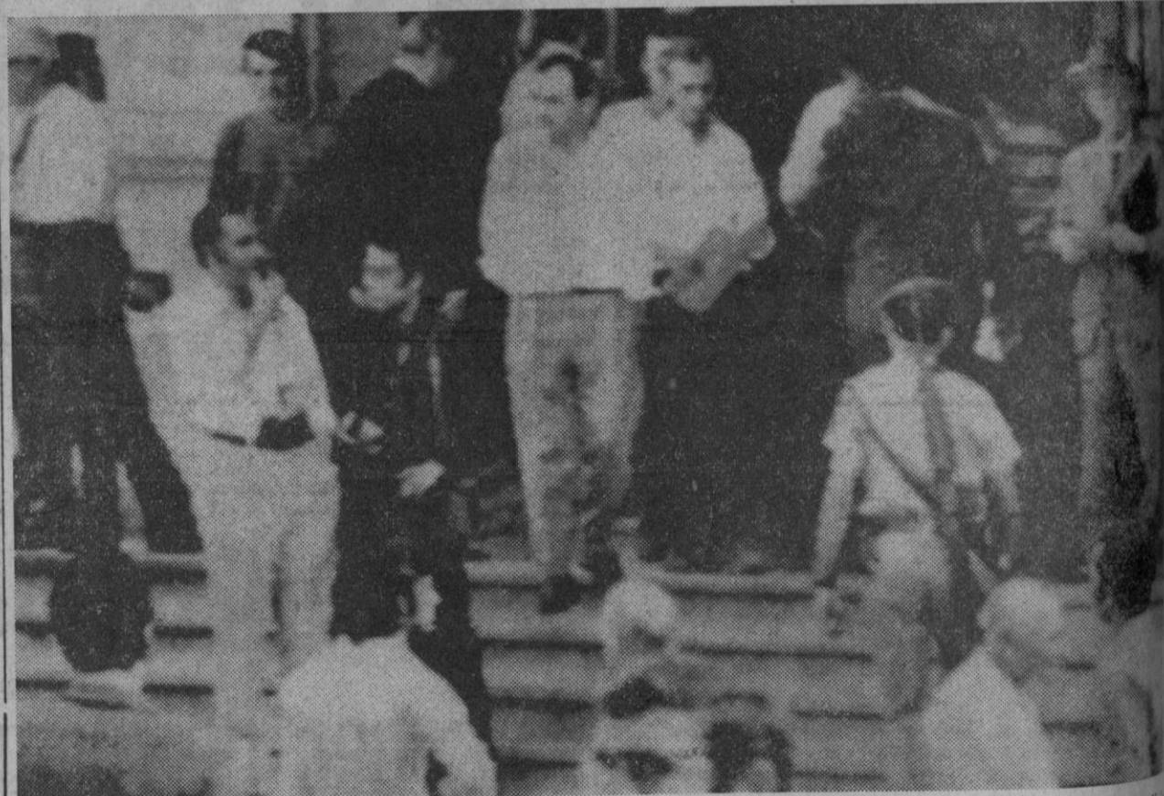
Esta es la oficina central de Correos de Beirut, donde han hecho explosión varias cartas-bomba. La Policía ha tomado precauciones especiales para evitar nuevos atentados de esta forma de crimen tan de moda ahora en el mundo.

Con el mismo fin de reforzar el control sobre los precios de los productos perecederos, serán fortalecidas en sus competencias las comisiones delegadas de precios, que actuarán divididas en ponencias, mediante plenas y de comisión permanente.—Europa Press.