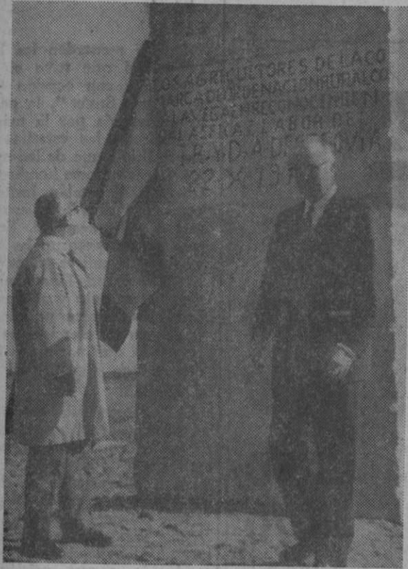
El gobernador civil y el presidente de IRYDA, momentos después de descorder la cortina que cubría la inscripción-dedicatoria del monolito de homenaje a dicho Instituto