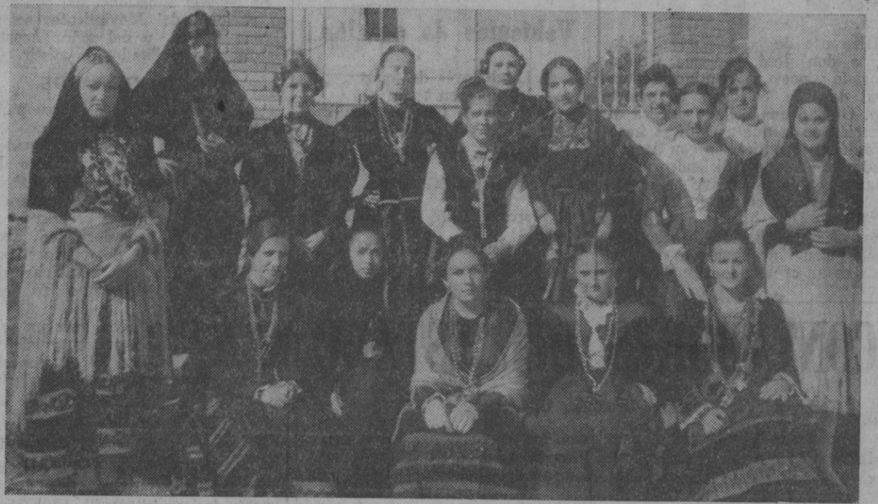
El grupo de damas de honor de la reina de las fiestas.