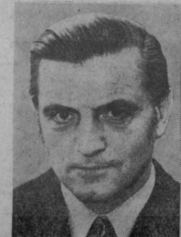
Dagfinn Vaarvik, nuevo ministro noruego de Asuntos Exteriores

Madrid, 23.—Excepto en la Facultad de Ciencias Políticas y Sociología y en la sección de Psicología de la Facultad de Filosofía y Letras, la actividad académica se ha reanudado hoy en todos los centros de enseñanza superior de la Universidad Complutense. Esta mañana han comenzado las clases en las Facultades de Filosofía y Letras, Ciencias y Ciencias de la Información. En los restantes centros las clases se iniciaron la pasada semana. A causa de la iniciación de un nuevo plan de estudios y del necesario acoplamiento de profesores y alumnos, las clases comenzarán en Políticas y Sociología el día 30 de octubre. Los alumnos de la especialidad de Psicología, por traslado de los locales a Somosaguas, comenzarán sus actividades el día 6 de noviembre. Tanto en los centros de la Universidad Autónoma, como en los de la Politécnica, la actividad es ya normal y general.—Cifra.