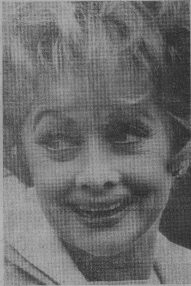
Lucille Ball abandona la televisión. Después de 21 años de éxito. Su fortuna es de varios millones de pesetas. Ahora va a interpretar el personaje de tía Mame en una nueva versión cinematográfica, aunque hace cuatro años dijo que no volvería a hacer cine. Y claro, afirma que, ahora, no puede partirse en trozos para estar en todas partes, estudios de cine y de TV.