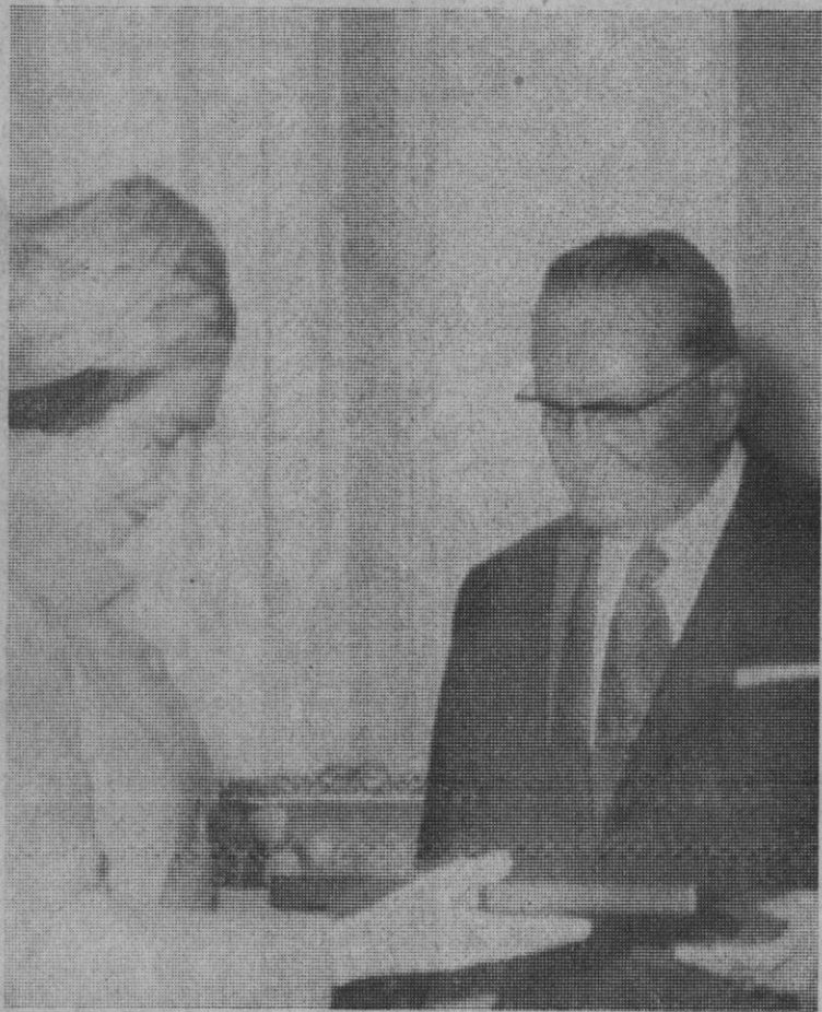
Belgrado.—La Reina Isabel de Inglaterra y el mariscal Tito intercambian altas condecoraciones.

Aparatos y equipo de a bordo Cosmos 525 siguen funcionando normalmente, y el centro de cálculos de coordinación prosigue procesando información recibida, concluye «Tass».—Efe.