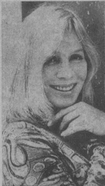
Una granjera. Ingrid Thulin. Odió vivir en una ciudad. Actriz que nunca ha sido una mujer hermosa, pero sí con un poderoso atractivo. Ahora, a sus 43 años, ha abandonado su preocupación por la belleza. Se ha comprado un castillo en Italia y su tarea es acondicionar y decorar sus 17 habitaciones.

Este año el Nobel de Literatura está dotado con 480.000 coronas suecas (6.934.982 pesetas).—Efe.