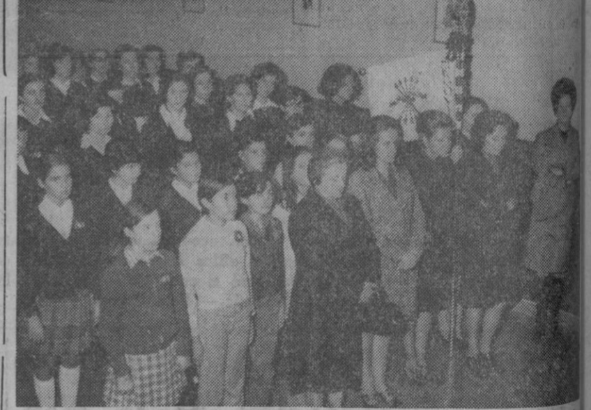
Sección Femenina celebró ayer la fiesta de su Patrona, conforme ya informamos. En la fotografía, en primera fila, aparecen las cinco ganadoras con distinciones por la Delegación Nacional. Detrás, un grupo de niñas a la O. J. E. femenina, durante el acto desarrollado en el salón de la Delegación, en el que se impusieron dichas condecoraciones.

Se nos informa también que la organización Sindical colabora en la exposición a través de la Obra Sindical de Artesanía, la cual se ha encargado del montaje de todo lo referente a las obras de los artesanos segovianos que participan y que en relación con ello, y cuya información completamos señalando que entre las aportaciones artesanas figura de cerámicas Gil Vargas, S. A., y con la denominación que se ha acordado constar en un principio.