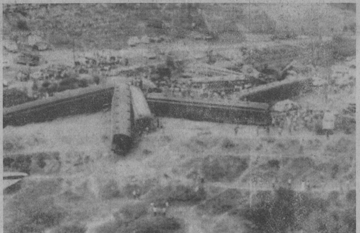
Saltillo (Méjico).—Vista aérea del tren que descarriló y se incendió posteriormente causando la muerte a más de ciento cincuenta personas. La mayoría de los pasajeros eran peregrinos.

CONDUCTOR: Recuerde que debe facilitar la maniobra de un vehículo que le adelanta y para ello debe ceñirse a su derecha